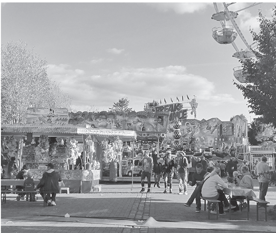
Diverse Fahrgeschäfte sorgen wie jedes Jahr für den nötigen Adrenalinkick beim traditionellen Oktoberfest.