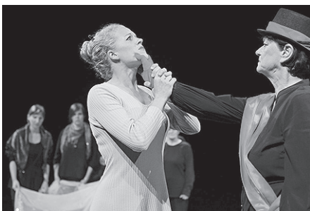
Auch Elsa fragt sich: Wenn die alte Macht stirbt, was kommt dann? Und: Hab' ich eine Wahl?