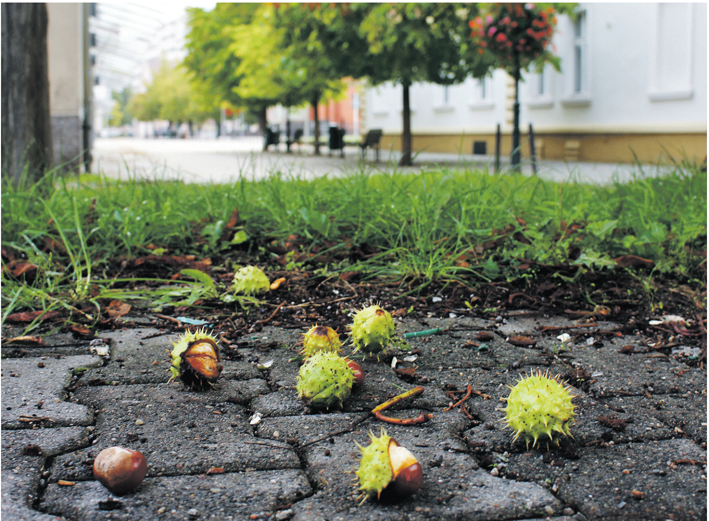
Sommer adé! Die bunte Jahreszeit steht vor der Tür und mit ihr auch das traditionelle Schwedter Oktoberfest. Nähere Informationen im redaktionellen Teil auf Seite 8