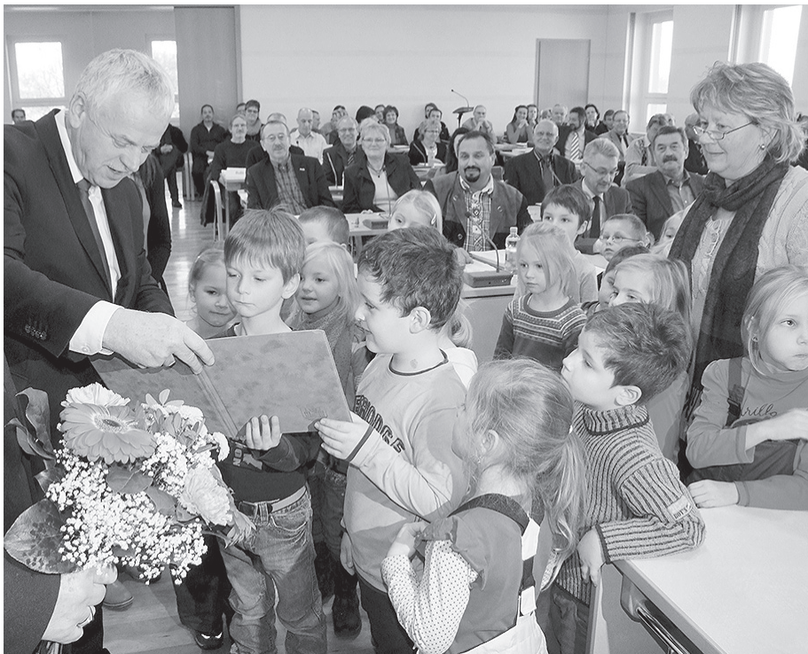
Der Preisträger von 2012 war die Vorschulgruppe der Kita „Friedrich Fröbel“ für das Projekt „Wir lieben und schützen die Natur“.

Bürgerinnen und Bürger, Vereine und Verbände, Bürgerinitiativen, Interessengemeinschaften und Organisationen, Schulen und Kitas sowie Kinder- und Jugendgruppen sind aufgefordert, sich mit ihren Projekten um diesen Preis zu bewerben.