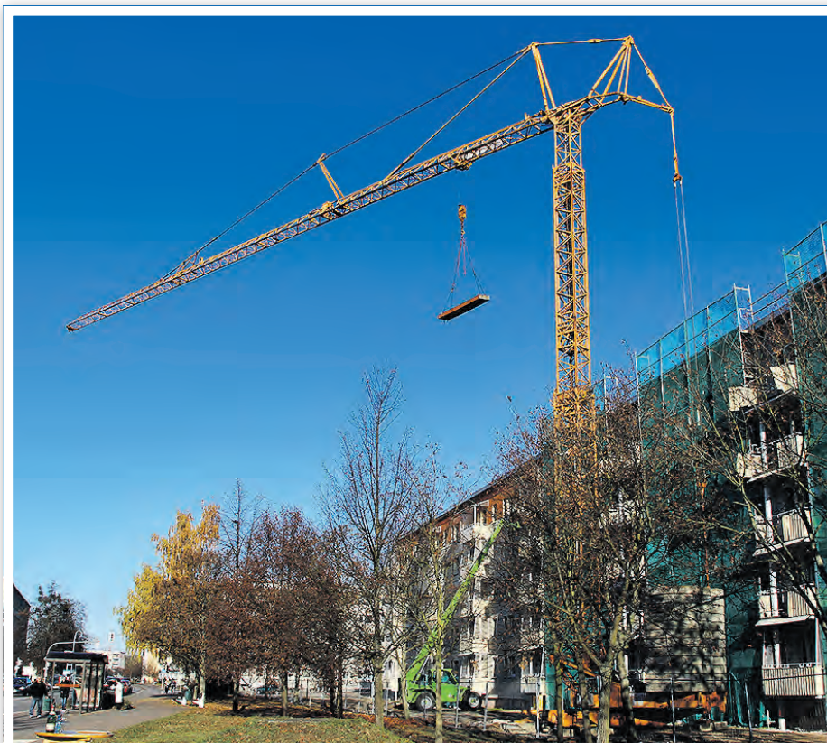
Mit der ersten abgetragenen Platte starteten die umfangreichen Um- und Neubaumaßnahmen am ersten Wohnblock des Julian-Marchlewski-Rings.

Entgegen der Wohnkomplexe des 1. und 2. Abschnittes – in denen zuerst zurückgebaut und anschließend neu aufgebaut wurde – wird hier vorrangig umgebaut und nur in Teilen der Bestandskomplex zurückgebaut. Es ist geplant, 10 Wohnungen an den Giebelaufgängen 2 und 16 vollständig und den Mitteltrakt bis zum 3. Geschoss abzutragen bzw. abzureißen. Ab März 2017 beginnen dann die Arbeiten an den neuen Giebelanbauten und die Umbaumaßnahmen an den Staffelgeschossen. Die Neubauten erhalten eine Klinkerfassade und lediglich der Altbestand des Wohnblockes – vier der acht Hausaufgänge – wird in weißem Putz gehalten. Komplementiert wird der zukünftige 3-Geschosser durch vier großzügige Penthouse-Wohnungen in dunkelgrauer Optik.