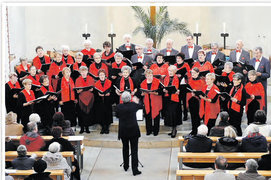
Adventskonzert der Schwedter Chöre in der evangelischen Kirche

Nationalpark-Chor Criewen, der Stadtchor Schwedt, der Chor des Seniorenvereins PCK sowie das Gesangsstudio der Musik- und Kunstschule Schwedt. Die Karten sind in der Tourist-Information erhältlich.