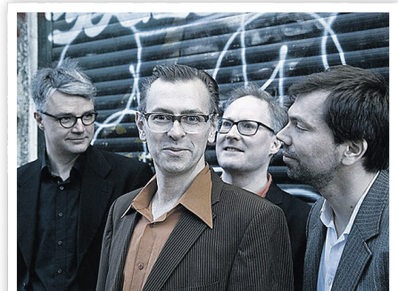
Die Berliner Band „Satumaa“

Jüdisches Museum mit Ritualbad Gartenstraße 6 ☎ 03332 234 60 www.schwedt.eu/de/242989 Einlass ab 14 Uhr, Konzertbeginn 15 Uhr, Eintritt: 10 €