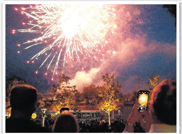
Das 15-minütige Feuerwerk erhielt sogar Applaus.

Mein besonderer Dank gilt den Unternehmen, die das Fest finanziell unterstützten: Wohnbauten GmbH Schwedt/Oder, PCK Raffinerie GmbH, Stadtparkasse Schwedt, Technische Werke Schwedt GmbH, Infra Schwedt Infrastruktur und Service GmbH, WISA Laboratorium GmbH, Bautechnisches Ingenieurbüro Prüfer & Wilke GbR, Baugesellschaft mbH Casekow, Bethke Baumschule-Gärtnerei-Landschaftsgestaltung, Zentral-Apotheke, IPB Indust-