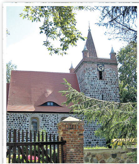
Feldsteinkirche in Heinersdorf

» Am 31. März 2019 wurde durch die Gemeindeglieder der Kirchengemeinde Heinersdorf folgende Festlegung getroffen: