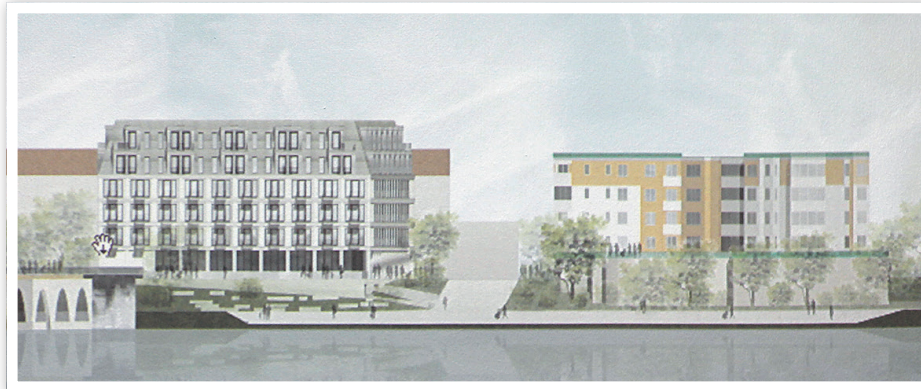
Grafik einer Ansicht von Hotel und Haus Polderblick