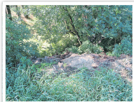
Grünschnitt in Heinersdorf

Wir rufen dazu auf, den kostenlosen, das Stadtbild nicht verschandelnden Weg über den Recyclinghof zu gehen!