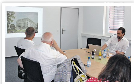
Pressekonferenz im Rathaus

Besonderen Gästen der Raffinerie würde man gern ein Hotel mit Spa in der