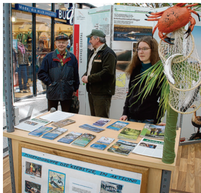
Mit Informationsständen wie diesen werben der Nationalpark und seine Partner für einen Besuch der einzigartigen Naturlandschaft der Region.

in Zusammenarbeit mit dem Kunstverein Schwedt einen Überblick über das