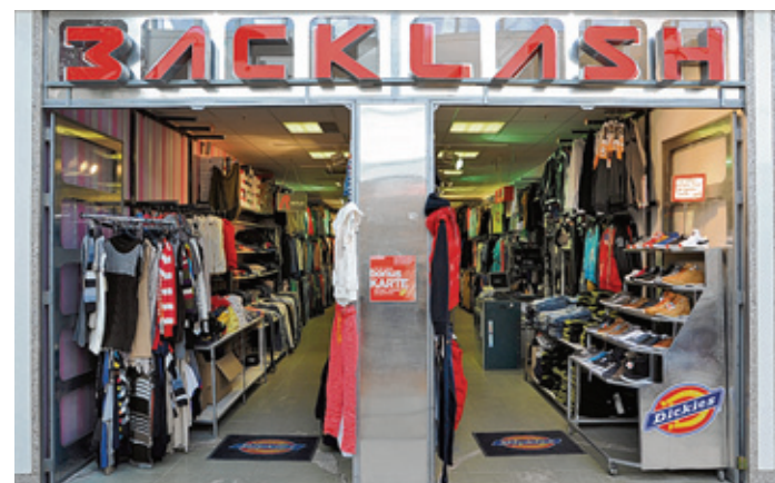
Backlash ist eines der traditionsreichsten Geschäfte im Oder-Center und will sich jetzt erheblich erweitern.

Dass nicht gleich Schulranzen Schulranzen ist, beweist außerdem eine durchdachte und clevere Innenausstattung. Sie unterstützt die Kinder beim Ordnunghalten und hilft, schwere Bücher leichter zu transportieren. Die Innenaufteilung sorgt für optimale Gewichtsverteilung innerhalb des Ranzens und auf dem Rücken der kleinen ABC-Schützen.