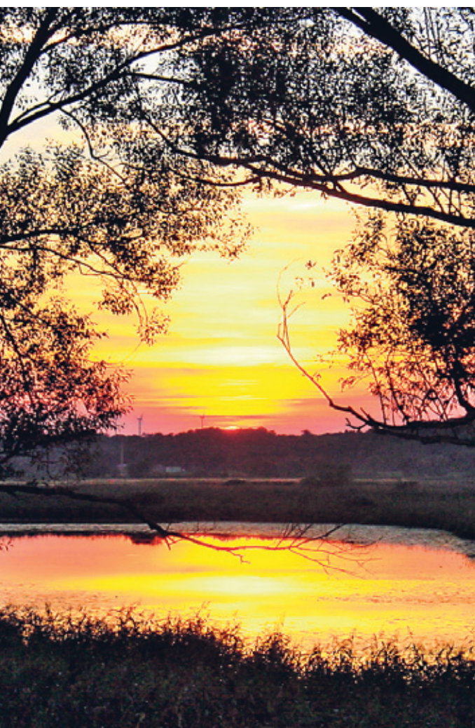
Die wunderschöne Natur liegt in Schwedt vor der Haustür. Mit der Aktion „Natur Grenzenlos“ macht das Oder-Center sie für seine Besucher erlebbar.