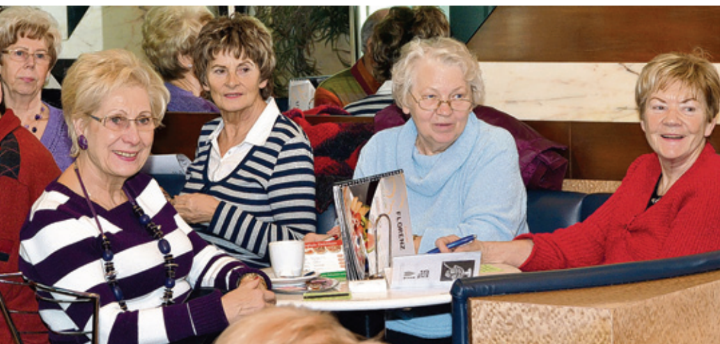
Das Senioren-Bingo im Eiscafé hat sich zu einer der beliebtesten Veranstaltungen im Center entwickelt.

Am 21. März sind die Plätze im Eiscafé im Oder-Center wieder heiß begehrt. Die Seniorinnen und Senioren treffen sich zu ihrem traditionellen Bingo-Spiel. Im vergangenen Herbst hatten das Center-Management und der PCK-Seniorenverein die Veranstaltungsreihe gestartet. „Wenn es ein Erfolg wird, werden wir es monatlich stattfinden lassen“, hatte