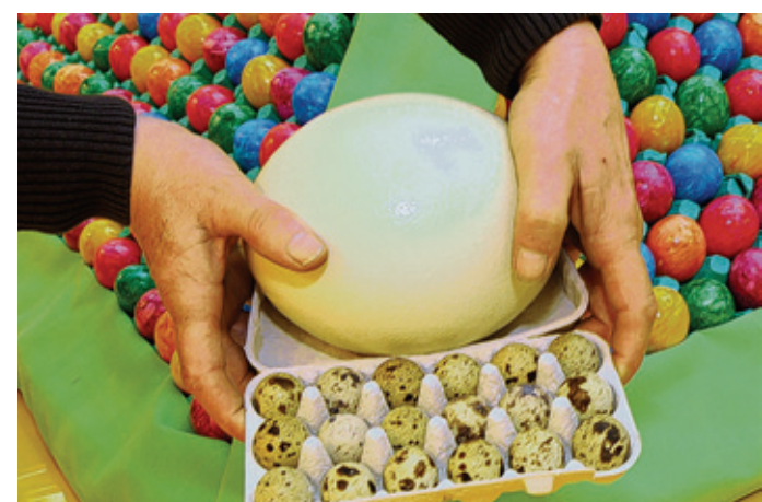
Eier in allen Größen und Farben gibt es auf dem Ostermarkt.