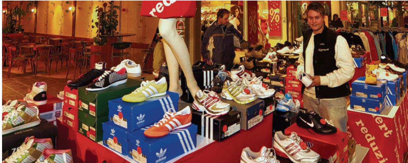
Zum grenzenlosen Einkaufsvergnügen lädt das Oder-Center am 1. April ein.