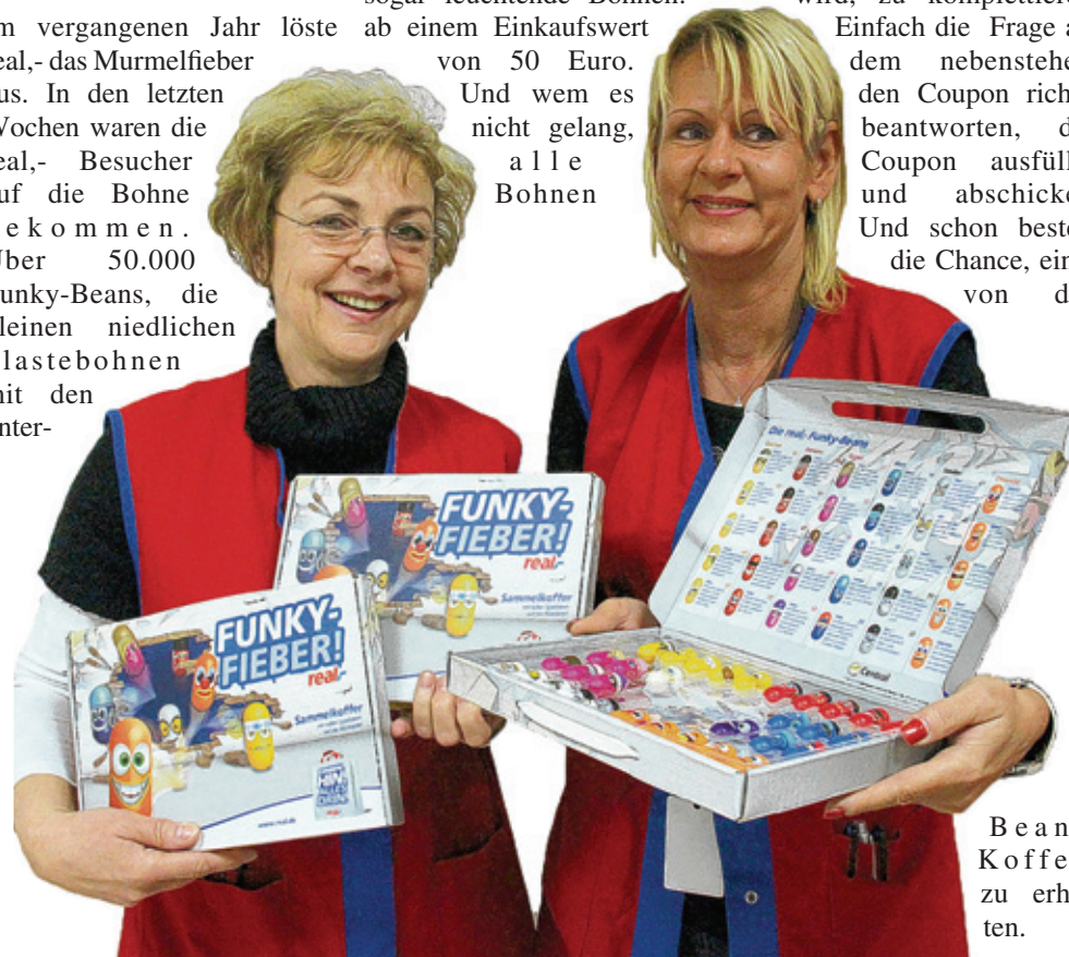
Beans-Koffern zu erhalten.