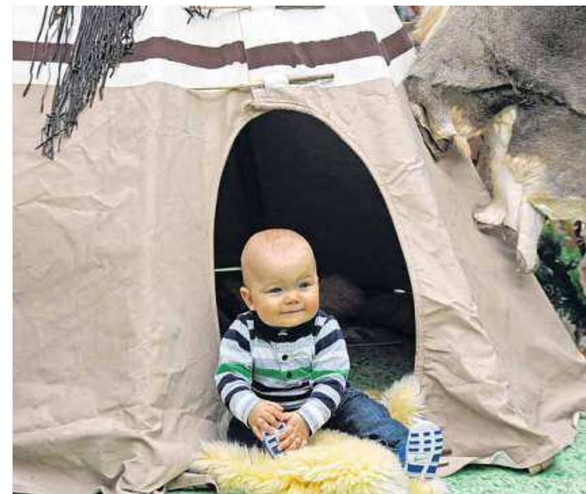
Cowboys und Indianer gastierten in den Sommerferien im Oder-Center. Die Ferienkinder konnten in eines der wohl beliebtesten Rollenspiele hineinschlüpfen und sich ganz den Wildwest-Abenteuern hingeben. Und ganz nebenbei wurden jede Menge Informationen über das Leben der Indianer und der Cowboys vermittelt.