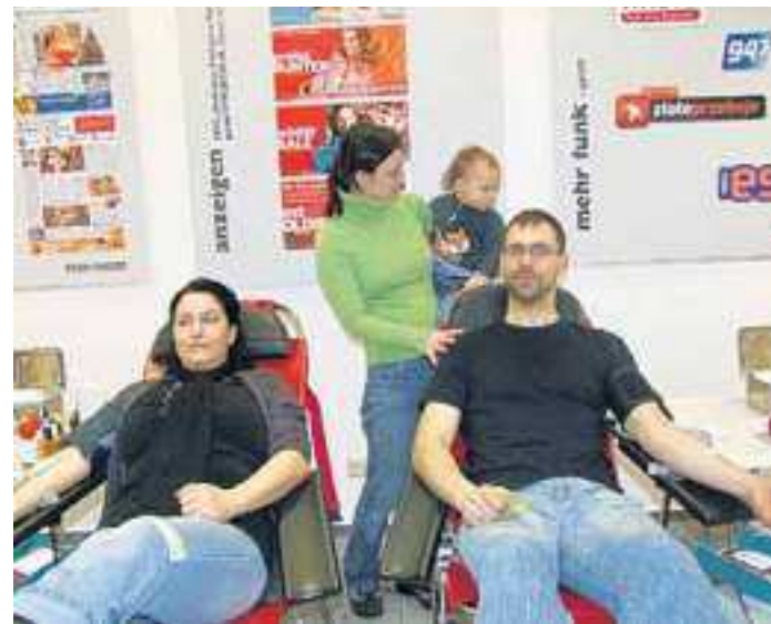
Viele Freiwillige nutzen die Gelegenheit, im Advent im Center Blut zu spenden.

Am 19. Dezember ist es wieder soweit. Bereits zum dritten mal verwandelt sich der Sitzungsraum im Center-Management in eine Blutspendezentrale. Zwischen 14 und 19 Uhr kann hier Blut gespendet werden. „Als wir diese Aktion vor zwei Jahren zum ersten mal gemeinsam mit der Blutspendezentrale durchführten, standen die Leute Schlange. Und auch im vergangenen Jahr war der Andrang riesig. Da war es für uns klar, dass wir auch in diesem Advent einen Blutspendetermin bei uns anbieten würden“, sagt Center Mana-