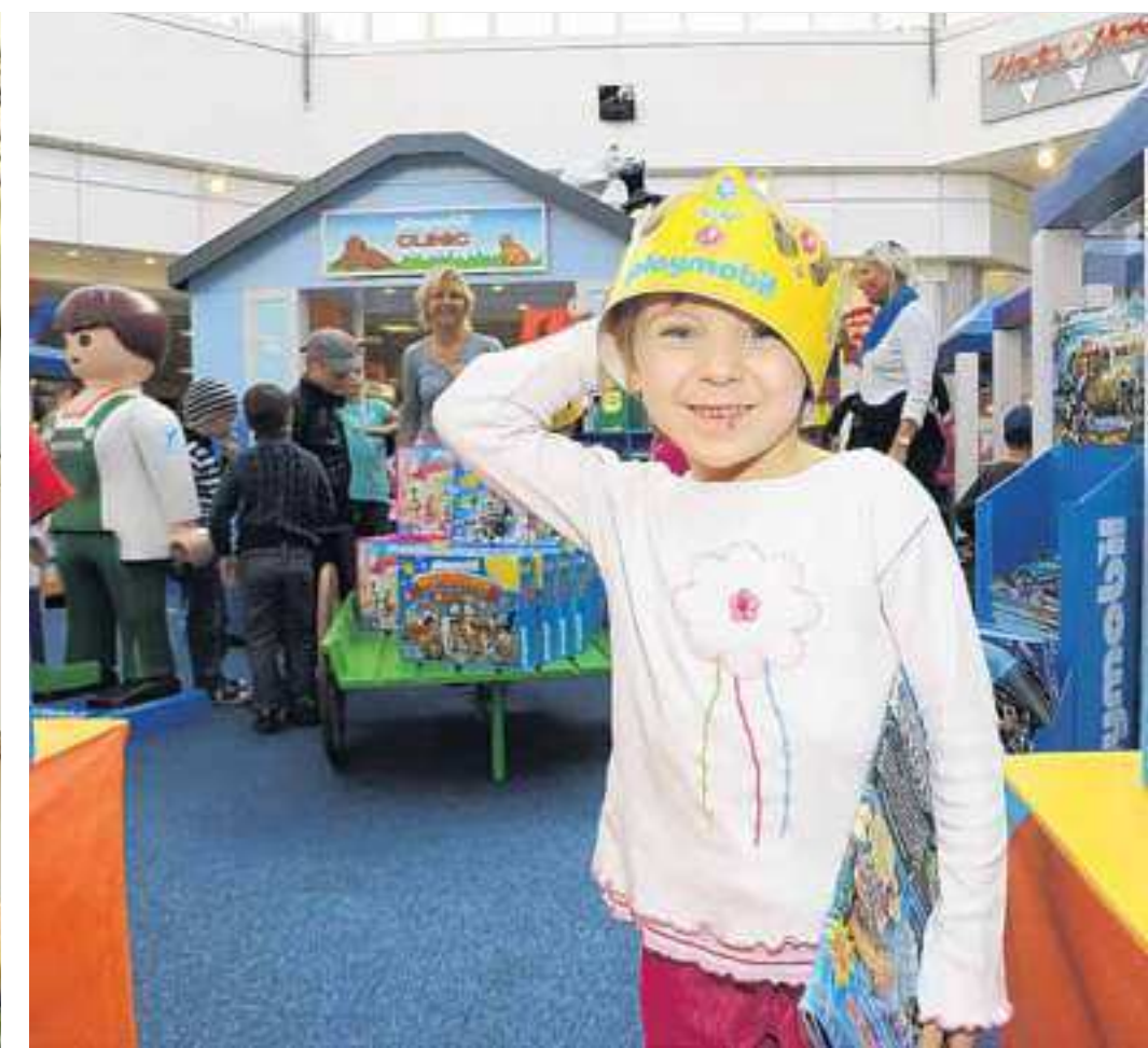
Zum zweiten mal Ferienspiele: Im Herbst kam Playmobil ins Oder-Center und begeisterte hunderte von Kindern, die nach Herzenslust mit den beliebten Bausteinen und Figuren spielen durften. Und nicht selten übertrug sich die Begeisterung auch auf Papa, Mama, Oma oder Opa, die ihre Kinder und Enkelkinder ins Center begleiteten.