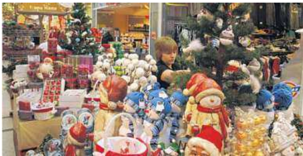
Alles für das Weihnachtsfest - hier weihnachtliche Accessoires von Nanu Nana - bietet der Weihnachtsmarkt im Center.

Das ist der Weihnachtsmarkt im Oder Center: Ein Lichtermeer taucht die üppig mit Weihnachtsüberraschungen gefüllten Stände in ein goldenes Licht. Es riecht an allen Ecken und Enden nach Weihnachten, die Klänge weihnachtlicher Chöre, die im Oktogon auftreten, bleiben in den Ohren hängen. Und der Weihnachtsmarkt bietet eine derartige Fülle an Geschenken, Weihnachtsschmuck, Obst und anderen Leckereien, dass die Auswahl wirklich schon schwer fällt. Hier gibt es phantastische Weihnachts- und Advents-Gestecke von Syringa, das Angermünder Gartenbau- und Floristik-Unternehmen hat auch weihnachtliche Holzschnitzereien aus dem Erzgebirge mitgebracht. Bäcker und Konditor Schäpe sorgt mit seinen weihnachtlichen Bäckereien für das leibliche Wohl der Besucher. Obst und Gemüse Wolf garan-