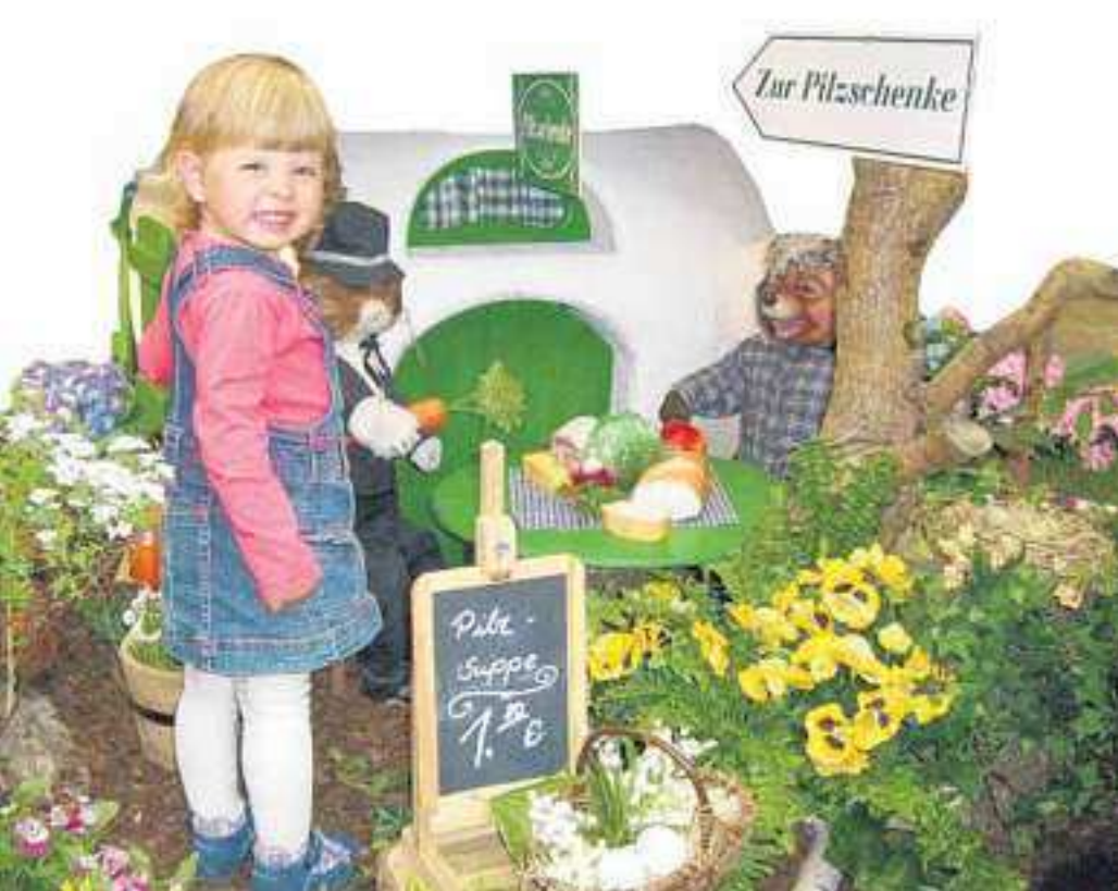
Pünktlich zum Osterfest kam der Frühling ins Oder-Center. Der traditionelle Ostermarkt wurde von der Pracht der Frühblüher umrandet. Und natürlich gab es für die jüngsten Besucher wieder den Osterhasen, der es sich in all der Frühjahrspracht vor seinem Bau mit Gevatter Igel bequem gemacht hatte. Eine Osteraktion, an der alle Besucher des Oder-Center einen riesigen Spaß hatten.