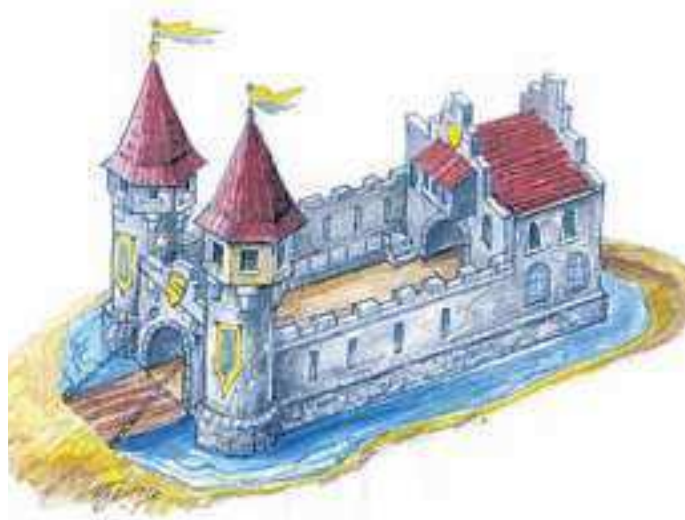
Die Ferienkinder können im kommenden Jahr im Center eine Zeitreise in die Welt der Ritter und des Mittelalters antreten.