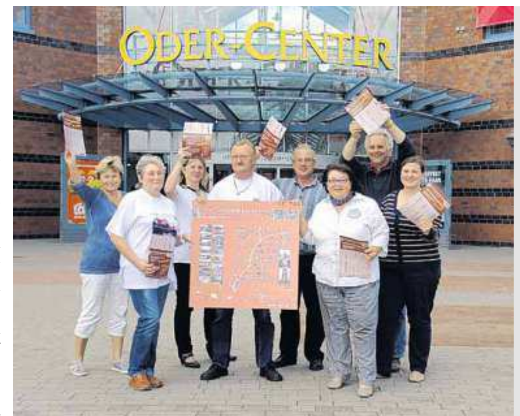
Im September öffneten sich die Schatzkammern der Region: 19 Museen aus der Region präsentierten sich in einer einzigartigen Ausstellung im Oder-Center. Der Renner dabei: Eine Eintrittskarte, die zum Besuch aller beteiligten Museen berechtigt, für nur 9,10 Euro. Und mit den Besuchern der einzelnen Einrichtungen kann sich der Karteninhaber noch bis Ende 2013 Zeit lassen. Denn so lange sind die Karten gültig.