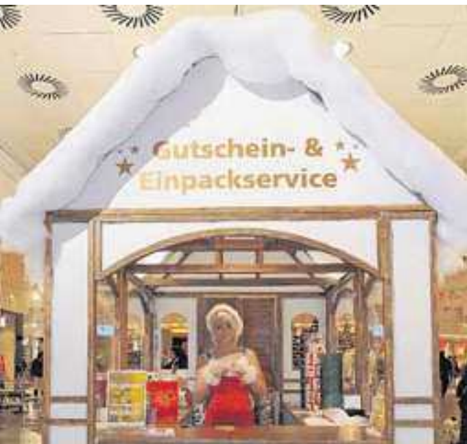
Toller Service: Hier werden die Geschenke professionell verpackt.

zu erfüllen. Er ist nicht nur in allen Geschäften des Oder-Center gültig, sondern in fast allen Center der ECE. Deutschlandweit. Damit eröffnet er eine Top-Auswahl an Geschenken.