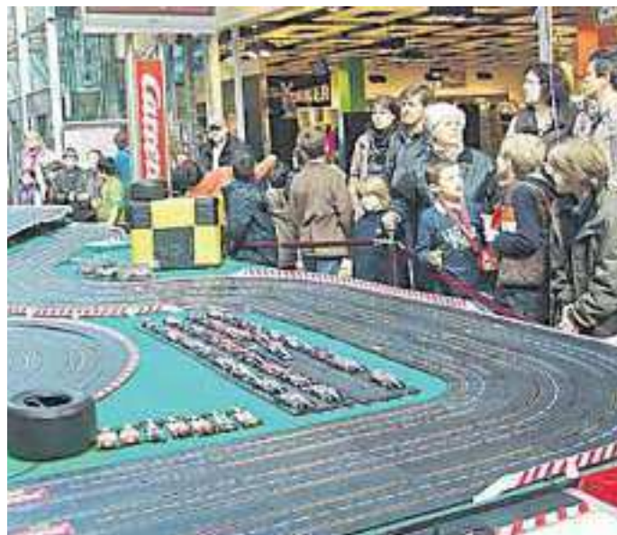
High-Speed im Miniaturformat. Carrera lädt im August zum Wettrennen ein. Hier werden Nerven gefragt sein.