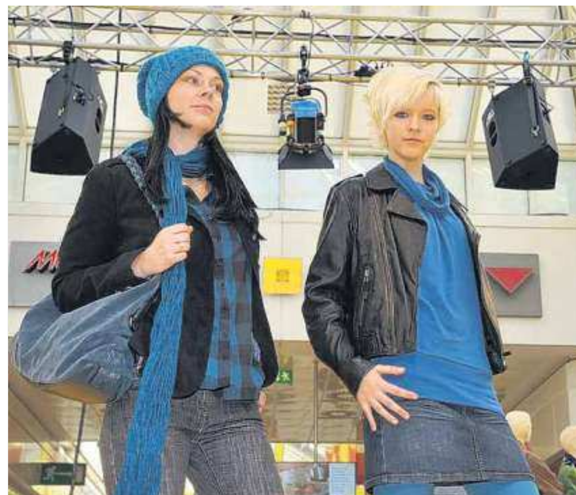
Das Mode-Center der Region lud ein: Im September zu den diesjährigen Modenschauen, auf denen Profi-Models die aktuellen Trends für den Herbst vorstellten. Mit seiner großen Vielfalt von verschiedenen Mode-Labels ist und bleibt das Oder-Center die Nr. 1 der Modebranche im Nordosten Brandenburgs.