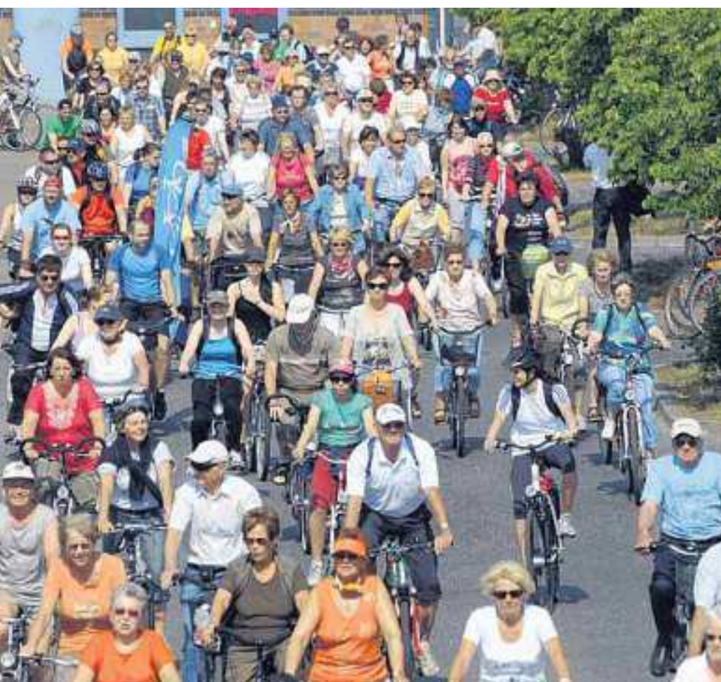
Ungewöhnlich spät hieß es diesmal im Juni: Hinaus zur Tour de Natur. Über 1000 begeisterte Radfahrer tourten bei schönstem Wetter durch das Untere Odertal. Für jede Kondition war etwas dabei: Die kurze Familientour, die auf direktem Weg von Schwedt nach Criewen führte oder die lange Sporttour, die etwas mehr Kondition erforderte.