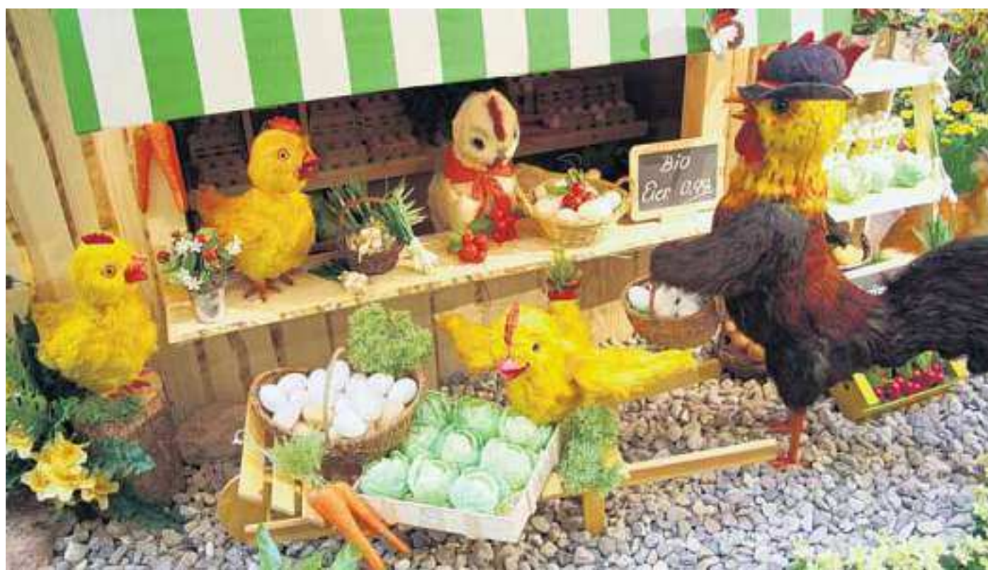
Neben den Frühjahrsblühern, die im kommenden Jahr übrigens ganz im Zeichen der fünften brandenburgischen Landesgartenschau blühen, bestimmt das liebe Federvieh mit einer Kükenbrutstation traditionell das Geschehen auf dem Ostermarkt.