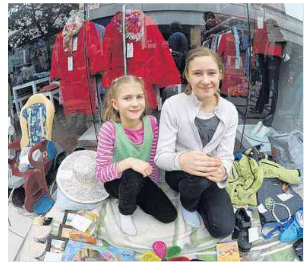
Wenn das Center zum Markt wird und ein lautes Gewirr von Kinderstimmen anhebt, dann ist Kinderflohmärkte-Zeit. Auch im zurückliegenden Jahr verwandelten sich die Ladenstraßen des Oder-Center in einen quirligen Markt, auf dem feilgeboten wurde, was die heimischen Kinderzimmer an unentdeckten Schätzen so hergeben: Spielzeug, Bücher, Puppen, Computerspiele und vieles mehr, was Kinderherzen höher schlagen lässt.