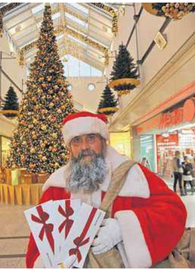
Der Weihnachtsmann empfiehlt: Der Gutschein ist das perfekte Geschenk.