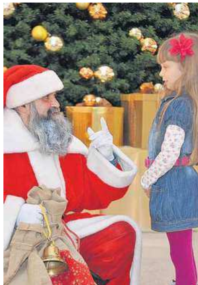
Auch der Weihnachtsmann wird seine Runden über den Weihnachtsmarkt drehen und die Kinder mit kleinen Geschenken erfreuen.