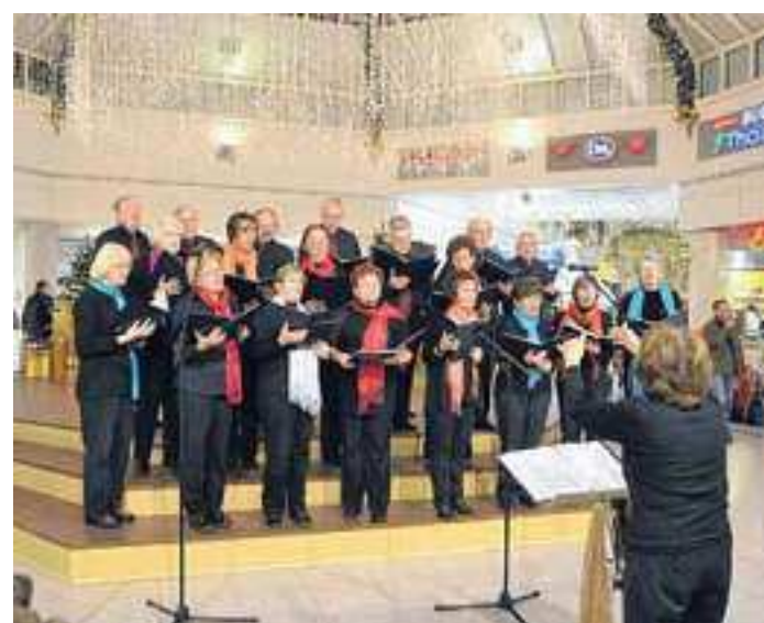
Chöre aus der Region begeistern die Zuhörer mit weihnachtlichen Liedern.