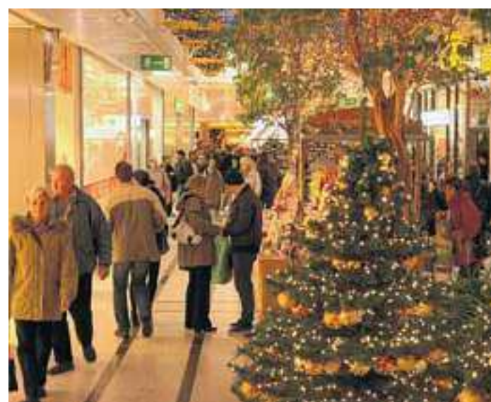
Tausende Lichter hüllen das Center in weihnachtliche Stimmung ein. So macht der Einkauf fürs Fest Spaß.