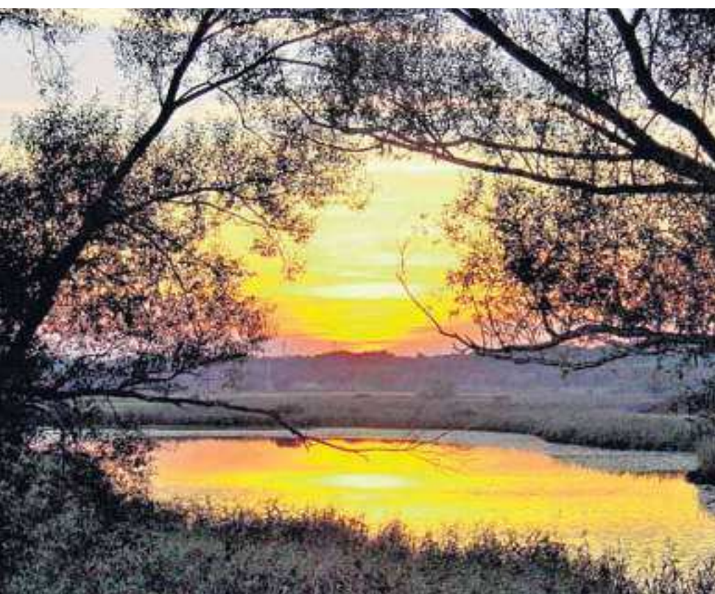
In die Schönheit des Nationalparks „Unteres Odertal“ und anderer Großschutzgebiete unserer Region entführte im Frühjahr die Aktion „Natur grenzenlos“. Die Besucher konnten sich einen Überblick über den einzigartigen Naturreichtum der Region verschaffen. Das machte bei nicht wenigen Lust auf mehr und sie starteten eine wirkliche Entdeckungsreise in die Natur, die gleich nebenan liegt.