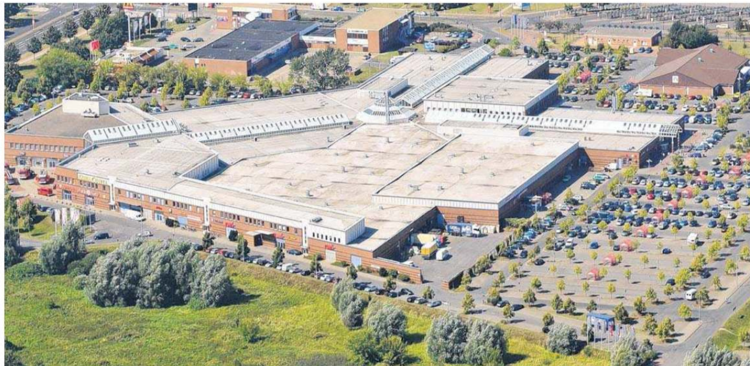
1500 kostenlose Parkplätze rund um das Center gehören in Schwedt selbstverständlich zum Service des Centers dazu. Für hohe Qualität des Service auch innerhalb des Centers garantieren alle Mitarbeiterinnen und Mitarbeiter in den Geschäften und in den Ladenpassagen.