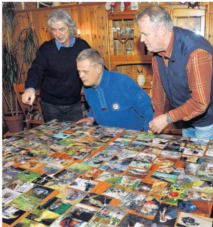
Die Jury, bestehend aus den Schwedter Fotografen Karl-Heinz Wendland, Michael Heinrich und Bernd Giesa, war begeistert über die hohe fotografische Qualität der meisten Einsendungen der Hobby-Fotografen.

Das größte Highlight der Aktion, die bis zum 20. April andauert, wird aber zweifellos die Ausstellung sein. Über 100 Hobby-Fotografen aus der Region waren dem gemeinsamen Aufruf des Oder-Center und des Zoos gefolgt, sich auf Fotopirsch durch die Eberswalder Zoowelt zu begeben. Mehrere