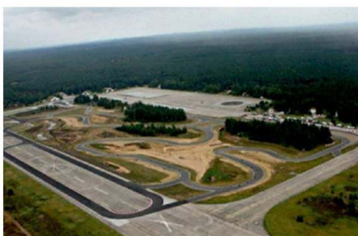
Luftbild der Anlage des Driving Center Groß Dölln

Das Driving Center Groß Dölln ist eines der größten Fahrsicherheitscentren Europas. Knapp 70 Kilometer von Berlin entfernt inmitten der Uckermark gelegen, wurden die Landebahnen und Rollwege eines ehemaligen Militärflughafens in Fahrsicherheits-, Trainings- und Repräsentationsflächen umgewandelt. Eine permanente Renn- und Teststrecke mit verschiedenen Rundkursen wurde 2009 in das Areal integriert. Fahrzeughersteller stellen bei Produktpräsentationen ihre neuesten Modelle vor. LKW- und PKW-Fahrtrainings werden sowohl für Profis als auch für junge und ältere Autofahrer durchgeführt, die das sichere Fahren im Straßenverkehr erlernen wollen. Spezialtrainings für behördliche und private Sicherheitsdienste finden genauso statt, wie spezielle Ausbildungslehrgänge für Motorsportprofis oder große und kleine Motorsportenthusiasten. Verschaffen Sie sich einen Überblick zu den vielfältigen Programmen