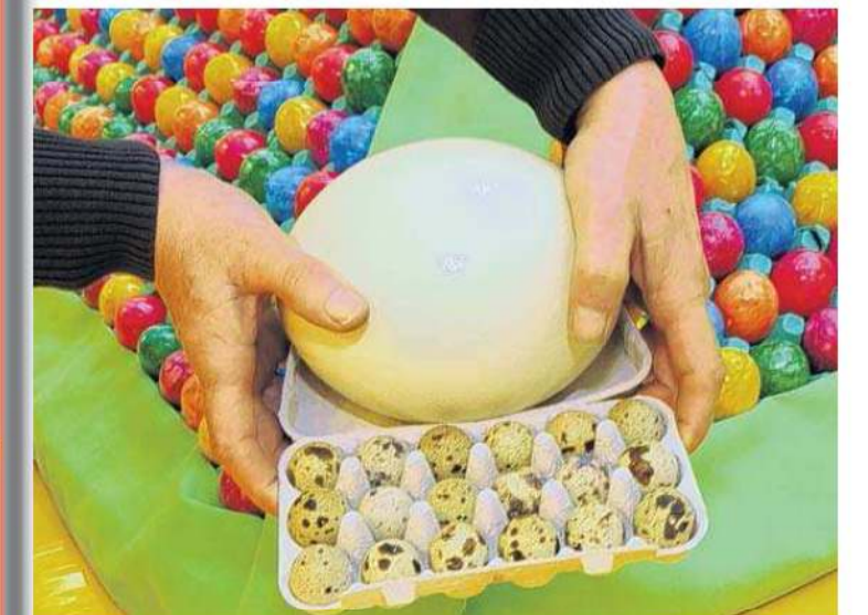
Zu Ostern geht es um ... Eier. Und diese werden dem Besucher des Osterfachmarktes nicht vorenthalten - es gibt sie in all ihrer Pracht und Herrlichkeit, von Vogel Strauß bis zum Wachtelei.