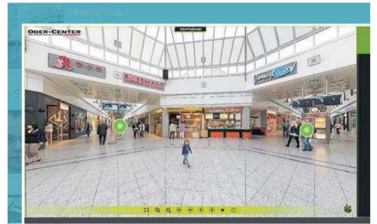
Jetzt kann man von überall auch virtuell durch das Oder-Center spazieren.