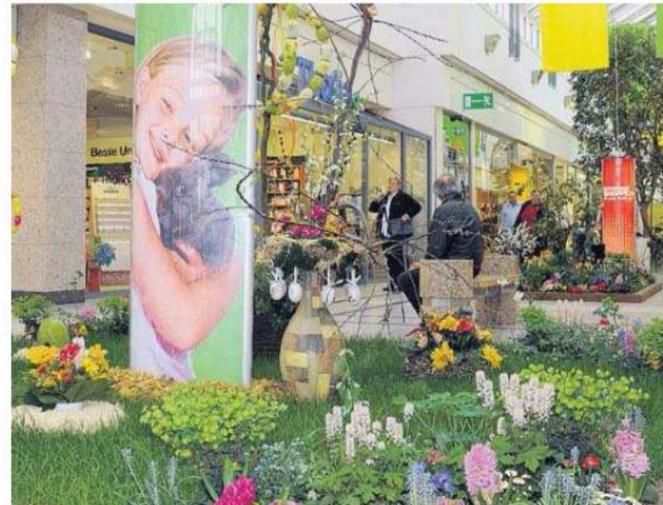
Ganz in frühlingshaften Blütenzauber getaucht präsentiert sich das ODER-Center zu Ostern. Der Frühling darf seinen bunten Siegeszug auch in die Ladenpassagen halten.