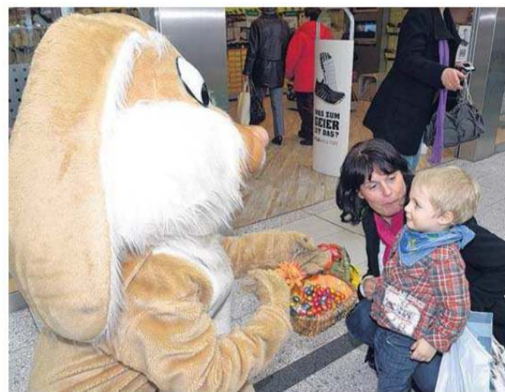
Wenn der Osterhase plötzlich auftaucht, braucht so mancher kleine Mann noch Zuspruch, ehe er bei den Süßigkeiten zugreift.

Echte Küken, eine Eierpyramide, Ostergeschenke und Blumenpracht, wohin das Auge schweift - das ist Ostern im ODER-Center.