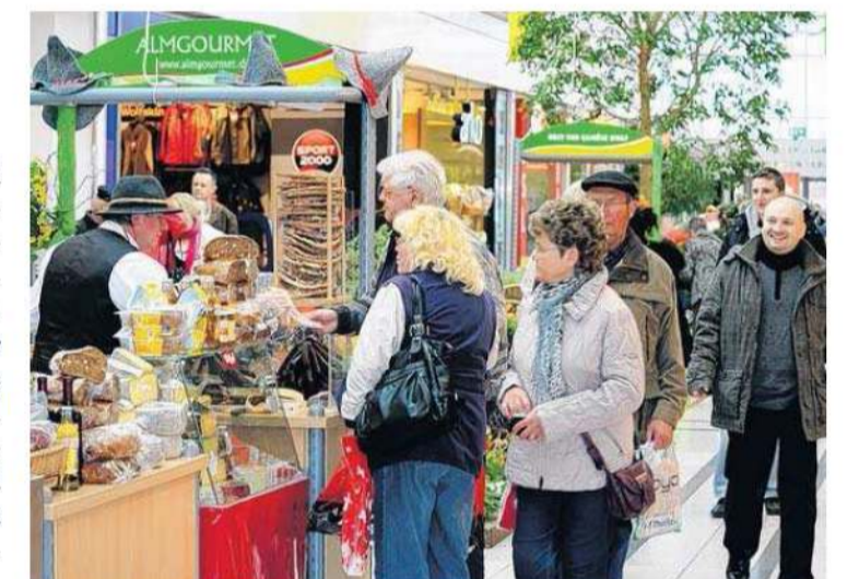
Lebendiges Treiben bestimmt das Bild in den Ladenpassagen des ODER-Center während der vorrösterlichen Zeit.

Ostersamstag, 30. März 10.00 - 12.00 Uhr Osterbäckerei für Kinder 15.00 - 17.00 Uhr Der Osterhase ist da 15.00 - 16.00 Bühnenprogramm für Kinder