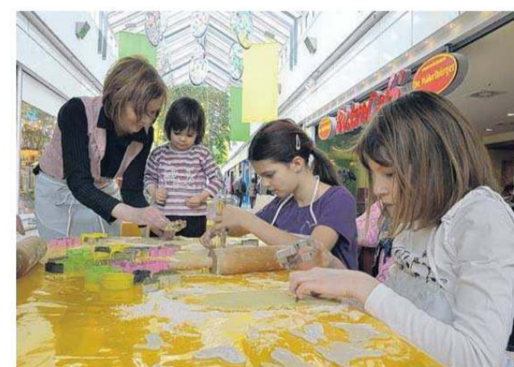
Während der Oster-Aktion können die Kinder auch leckere Plätzchen formen, die dann bei Bäcker Schäpe gebacken werden.