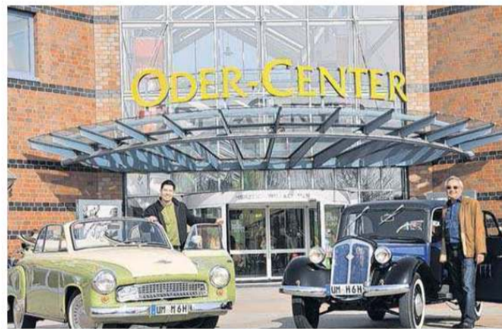
Eine der beliebtesten Aktionen der letzten Jahre war die Präsentation der Ost-Oldies im Oder-Center.

Die Besucher sind gefragt: Was wollen Sie im Center erleben?