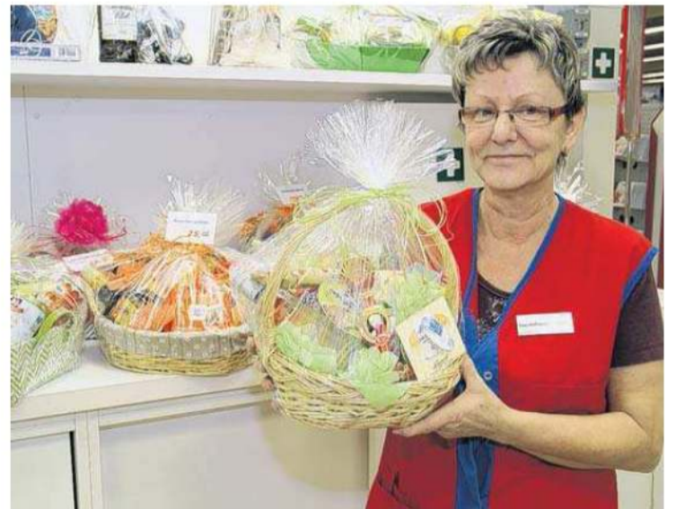
Schicke Präsentkörbe für den festlichen Anlass können die Center-Besucher bei real,- an der Info-Theke erhalten.