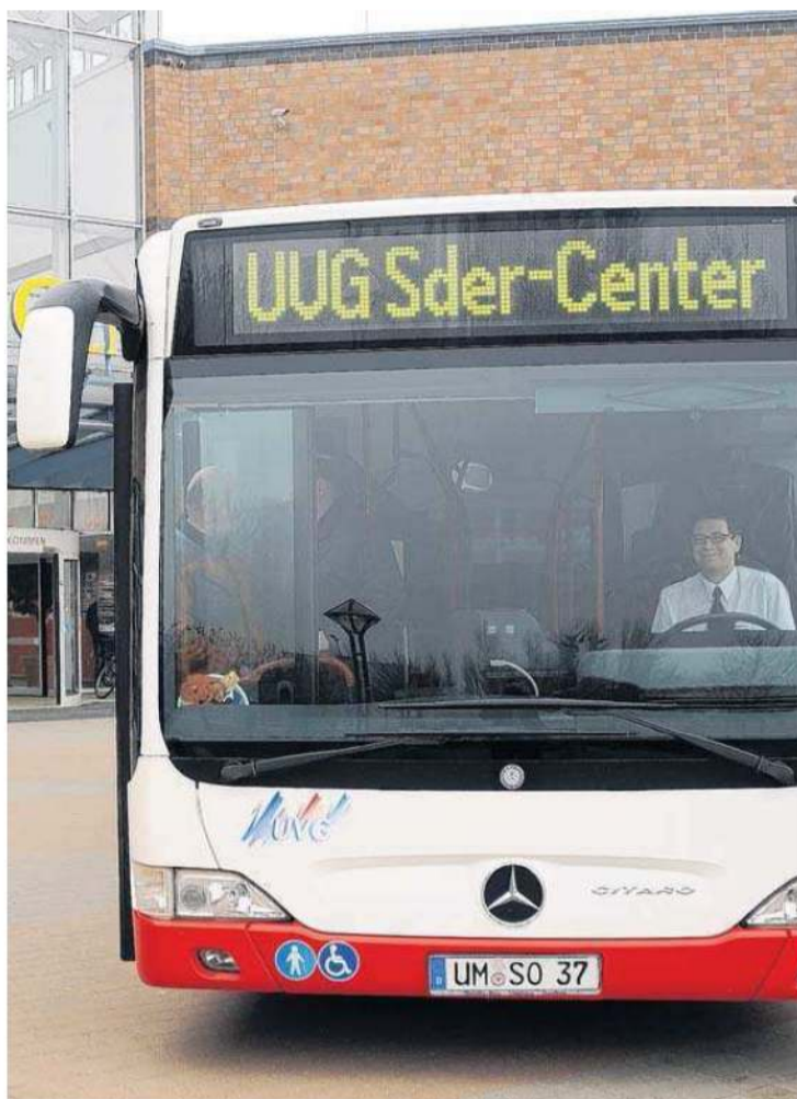
Jetzt können sich Besucher des Oder-Center ihre Einkäufe uckermarkweit von der UVG nach Hause fahren lassen - und daheim am Busbahnhof abholen.

Das KombiBus-Projekt läuft seit Mitte vergangenen Jahres im Rahmen des Modellvorhabens „LandZukunft“ des Bundeslandwirtschaftsministeriums. Diesem Projekt liegt die Idee zugrunde, die ohnehin fahrenden Buslinien auch für den Waren-