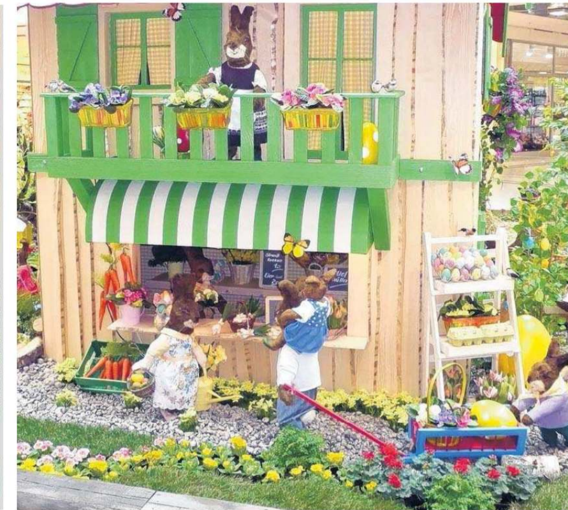
Kurz vor dem Osterfest herrscht reges Treiben vor dem österlichen Hasengeschäft. Wie gut, dass sie nicht nur Ostereier finden, sondern auch leckere Möhren, um Kraft für das Osterfest zu tanken.