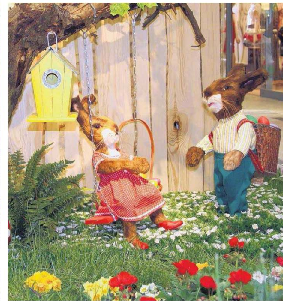
Pause muss auch mal sein. Die Häslein verschnauft auf der Schaukel. Vater Hase jedoch trägt einen schweren Korb bunter Ostereier, die bald verteilt sein wollen.