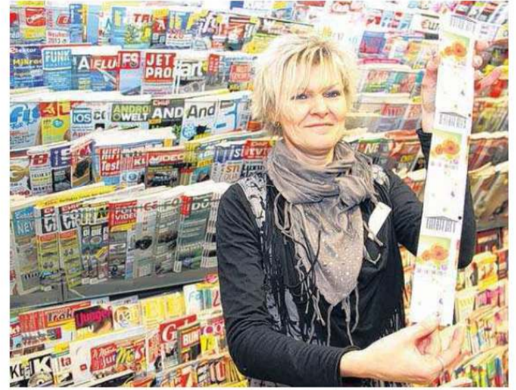
Wer Karten für die Landesgartenschau braucht, kann diese auch bei Wolsdorf erwerben.