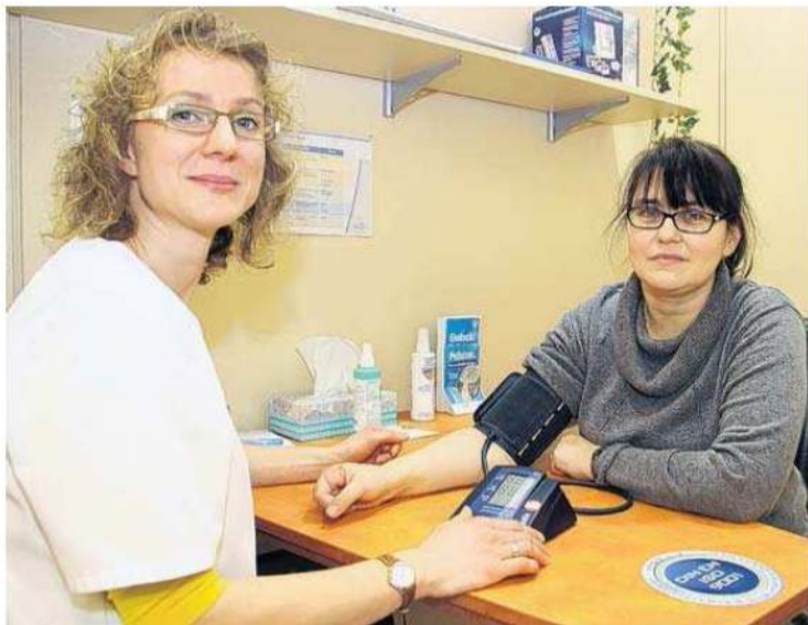
Wer seinen Blutdruck messen lassen will, kann dazu auch in die Pluspunkt Apotheke ins Oder-Center gehen.