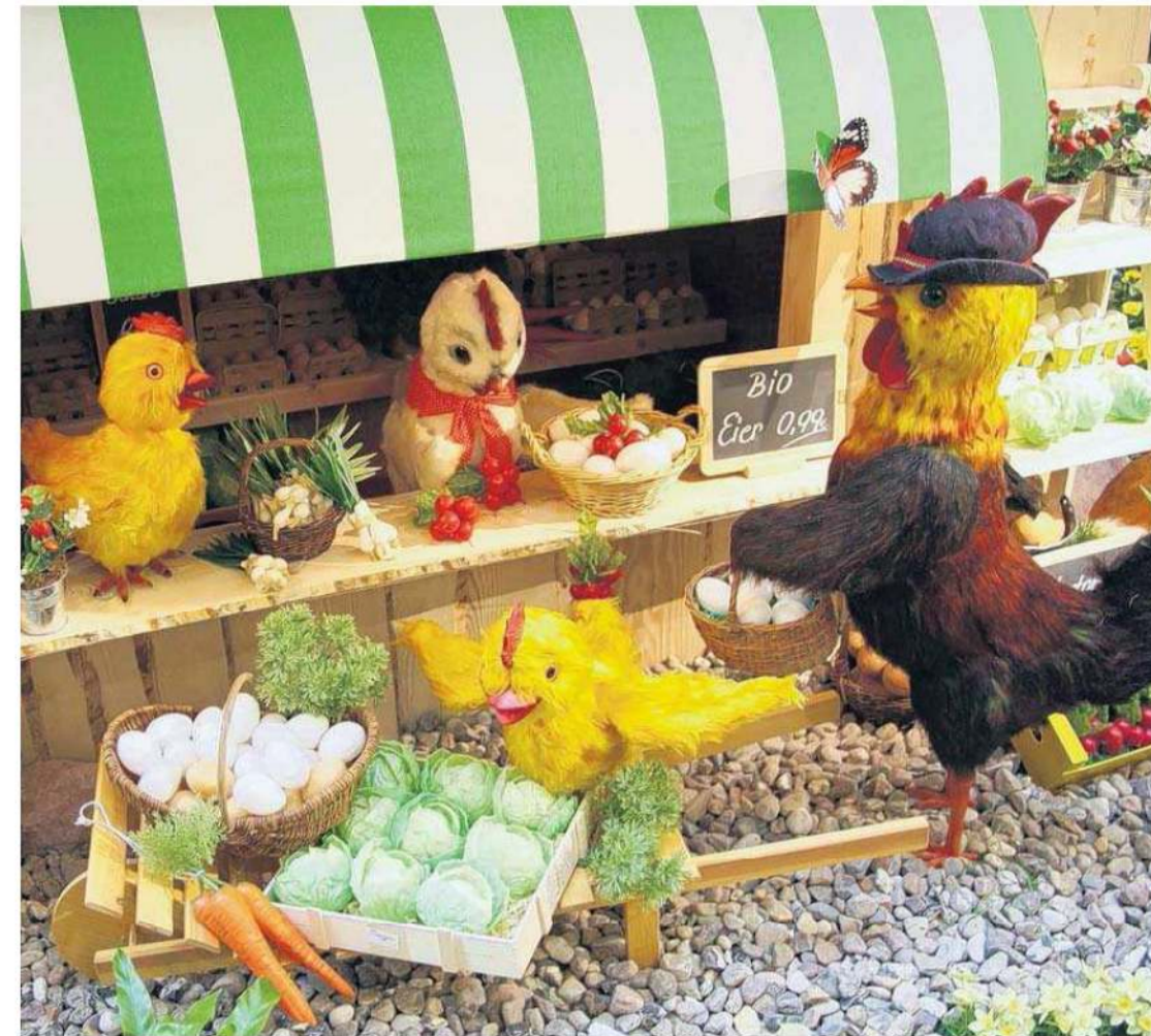
Reges Treiben herrscht an der Kükenbrutstation. Selbst der Hahn lässt es sich nicht nehmen, nach dem Rechten zu schauen und mit den Küken ein Schwätzchen zu halten.