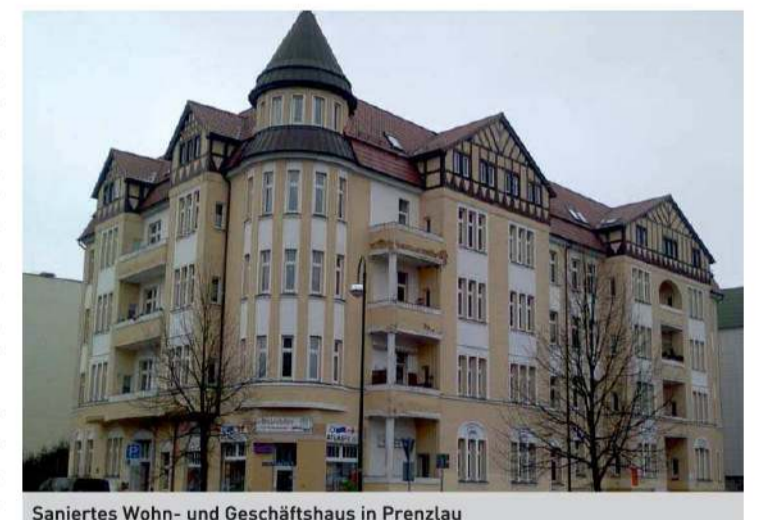
Saniertes Wohn- und Geschäftshaus in Prenzlau

nuerlich an Weiterbildungen und Qualifizierungen teil und bauen Ihr fachliches Know-how für Sie ständig weiter aus. Alle übernommenen Aufträge werden zuverlässig und nach geltenden Standards ausgeführt.