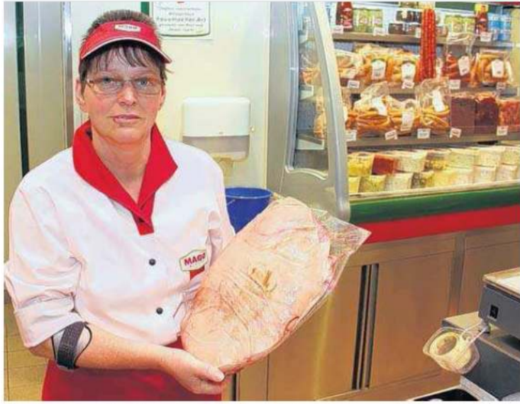
Wer für die Familienfeier oder die Gartenparty im Sommer ein halbes Schwein braucht, kann das bei Mago kaufen.