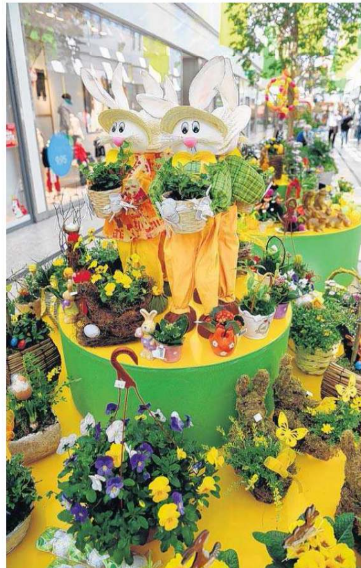
Kurze Wege verspricht der Osterfachmarkt: Von österlicher Dekoration über Malfarben bis hin zu österlichen Geschenken gibt es hier alles auf direktem Weg zu kaufen.