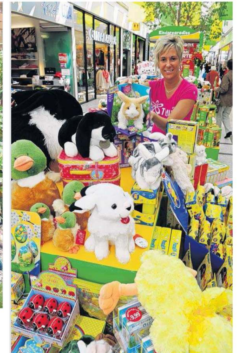
Natürlich bietet der Osterfachmarkt auch jede Menge Überraschungen und tolle Geschenke für die Kinder.