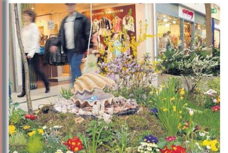
Die Farbenpracht, an der die Besucher entlang bummeln, gibt einen Vorgeschmack auf das Wunder Frühling, das in der Natur bevorsteht.