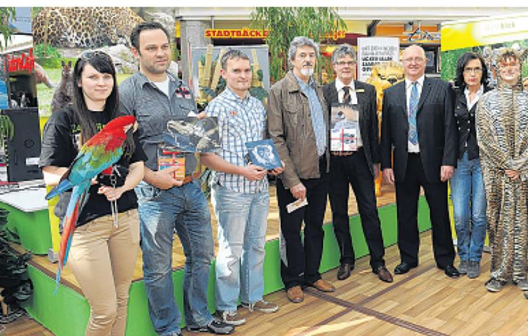
Vertreter des Zoos Eberswalde, der Sponsoren des Fotowettbewerbs und natürlich der Gewinner bei der Auszeichnung der besten „tierischen“ Fotos.