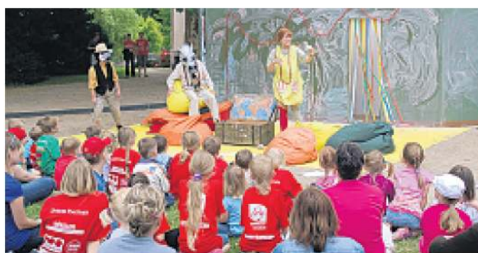
Auch in diesem Jahr sorgen die Uckermärkischen Bühnen Schwedt mit ihrem Kindertheaterstück für Spaß und Spannung.