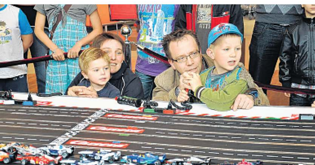
Spannende Momente beim Verfolgen der Rennen.