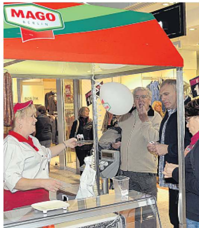
Jede Menge Genuss für Gaumen, Nase und Augen garantiert die Schlemmermeile, zu der das Center vom 27. Mai bis 1. Juni einlädt.

schlagen lässt. Den Besuchern begegnen auf der Schlemmermeile keine unbekannteren Partner. Obst Wolf sorgt schon seit Jahren auf den Weihnachts- und Osteraktionen für frische Vitamine. Dass es bei Mago tolle Wurst und gut gewürztes Fleisch gibt, hat sich schon längst herumgesprochen. Und der Schwedter Bäcker und Konditor Schäpe ist weit über die Stadtgrenzen für seine guten Torten, Kuchen und Backwaren bekannt. Im Übrigen geht es bei der Schlemmermeile nicht nur ums gute Essen, sondern auch den richtigen Tropfen zum Verdauen. Die Marxdorfer Liköre werden ebenfalls hier angeboten.