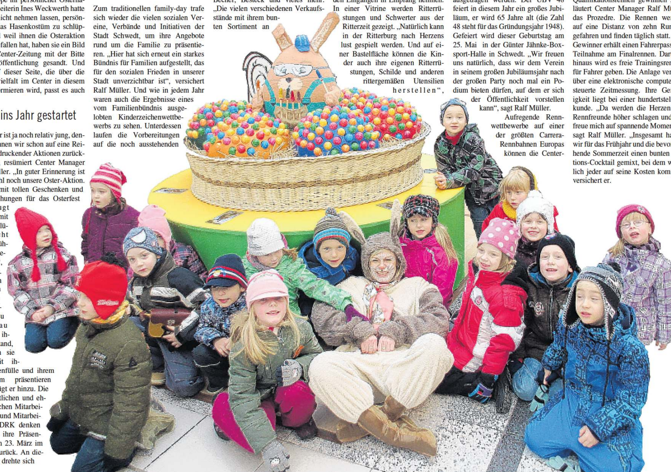
Die Vorschulgruppe der Kita „Uckis Spatzenhaus“ hatte einen riesigen Spaß an der diesjährigen Oster-Aktion und brachte sogar ihren eigenen Osterhasen mit.