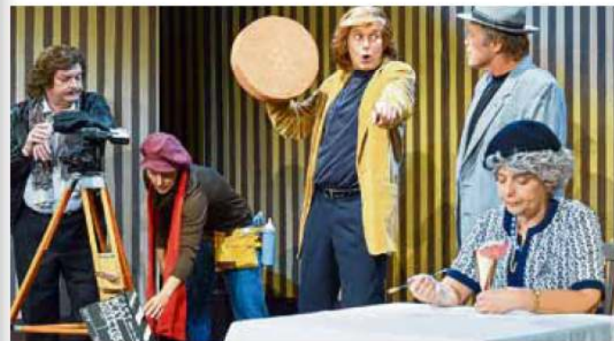
Am 25. Mai gastieren die Uckermärkischen Bühnen mit ihrer Inszenierung „Loriot - Best of“ auf der Landesgartenschau.

Frauenpower sorgt das „Damenorchester Salomé“ am Pfingstsonntag. Weitere Formationen sind die Saspower Dixieland Stomper und die Band „Jazz?Rock“. Seinen Abschluss findet das Jazzfest am Pfingstmontag mit den „6 Richtigen“, die ab 14 Uhr auf der Freilichtbühne zu erleben sind.