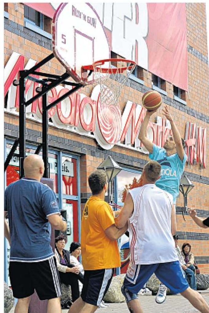
Sportlich geht es auf dem Center-Vorplatz zu, wenn er sich einmal im Jahr in eine Streetball-Arena verwandelt.