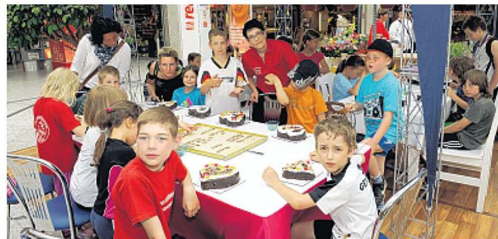
Die Kinder verzieren die Torten, um ihren Müttern damit eine Freude zu bereiten.

Kleinen ihre Muttertagstörtchen nach Herzenslust verzieren - und somit ein ganz persönliches Geschenk für ihre Muttis mit nach Hause nehmen. Aber nicht nur die mit einer Torte bedachten Mütter können sich freuen. Mit dem Erlös der Spendenaktion wird seit Jahren die Arbeit des Frauenhauses in Schwedt unterstützt. So werden die Mütter bedacht, die im Leben nichts geschenkt bekommen.