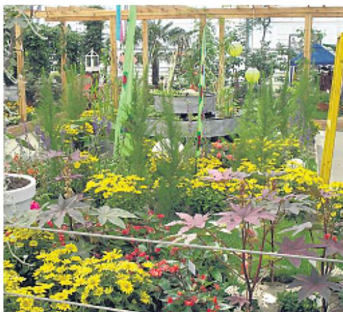
Die Hallenschauen versprechen einen Schmaus für die Sinne.

„FarbenRund von Wundern der Facetten“ - Unter diesem Titel steht die zweite Hallenschau der Landesgartenschau Prenzlau, die vom 3. bis 16. Mai in der Blumenhalle stattfindet. Die Zeit der Beet- und Balkonpflanzen beginnt. Jetzt kommt Farbe auf die Balkone und Terrassen. Diese sind als Wohnzimmer im Freien nicht mehr wegzudenken. Gestaltungsideen geben Anregung für eigene kreative Umsetzungen. Die ganze Palette der Beet- und Balkonpflanzen wird gekonnt in Szene gesetzt. Das üppige Sortiment – reich an Farbvielfalt und aktuellen Trends entsprechend - reicht von Calibrachoa, den kleinblumigen Petunien, über Lobelien (Männertreu) und Tagetes (Studentenblumen) bis