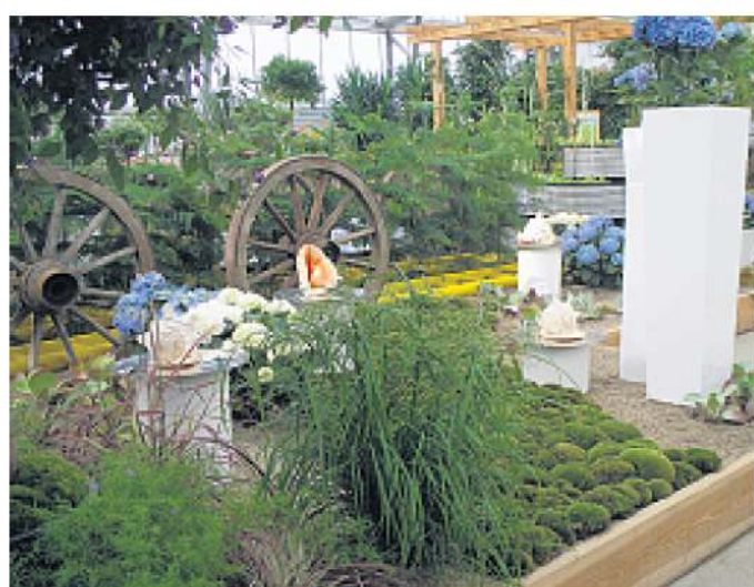
Kunstvolle Arrangements von Blumen und Dekorationen machen die Hallenschauen zu einem unvergesslichen Erlebnis.

weiß gesternte buschig leicht überhängend wachsende Vertreterin ihrer Art. In die Höhe geht es mit Ampelpflanzen. Kübelpflanzen schaffen zusätzlich Akzente. Besondere Hingucker sind Formgehölze und floristische Werkstücke. Auch für Wissensdurstige ist etwas dabei: Der Ginkgo - eine in