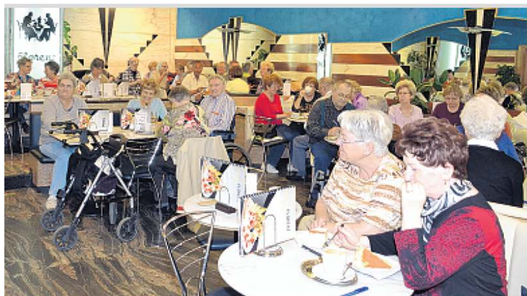
Spannung pur und gute Gespräche im Miteinander der Seniorinnen und Senioren garantiert das Bingo-Spiel.