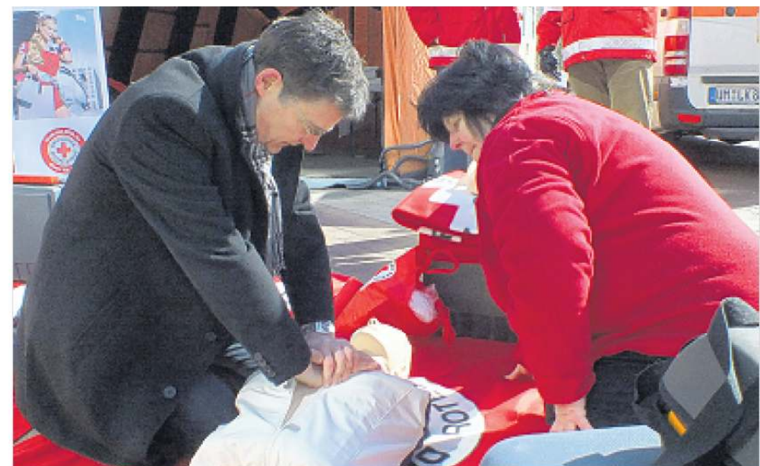
Prominenz beim DRK: Der Bundestagsabgeordnete Jens Koepen übt sich in der Herzdruckmassage.