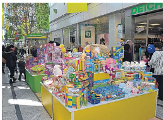
Das Kinderparadies lädt auch in diesem Jahr wieder zum Kindertag-Fachmarkt ein. Vom 24. Mai bis zum 1. Juni gibt es hier alles, was Kinderherzen garantiert höher schlagen lässt.