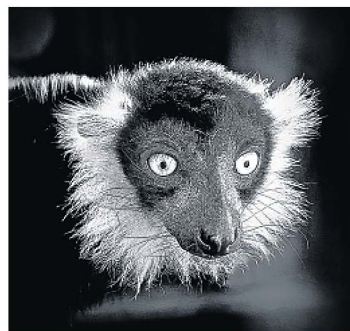
Für den 2. Platz wählte die Jury dieses Bild des Wriezeners Tilo Dewitz aus.