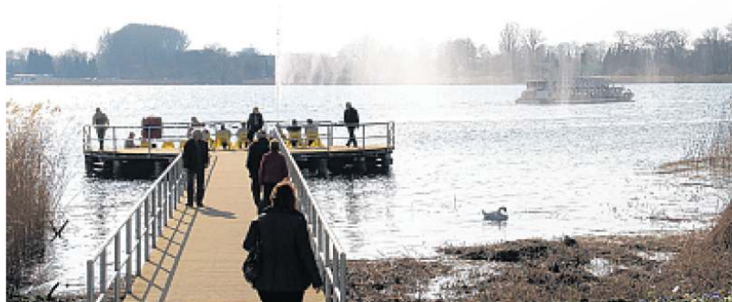
Die Besucher nehmen das Sonnendeck in ihren Besitz (links). Ministerpräsident Matthias Platzeck eröffnete die LaGa mit dem Ruf: „Gut Zupf“ (Mitte). Als Blumen verkleidete Stelzenläufer neckten die Gäste des Eröffnungstages (rechts).