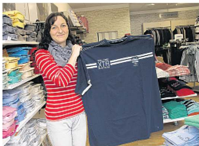
Bei Fresh Look gibt es Mode auch für starke Männer - bis zur sensationellen Größe von 6 XL.