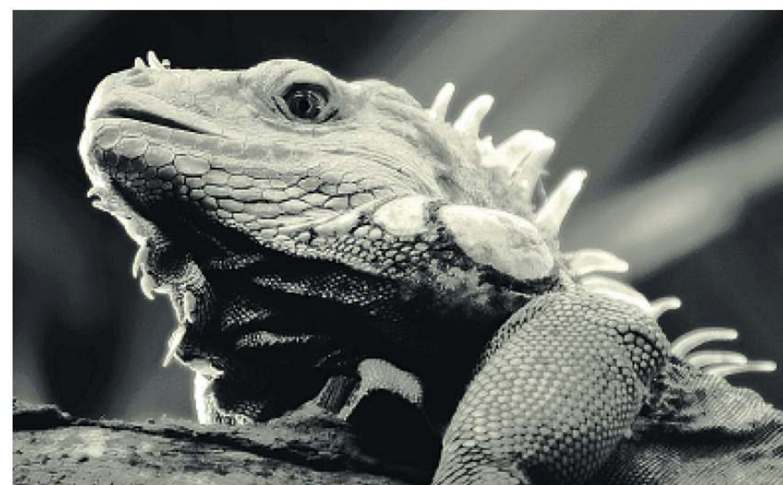
Frank Meyer aus Eberswalde landete mit diesem beeindruckenden Foto auf dem 3. Platz.