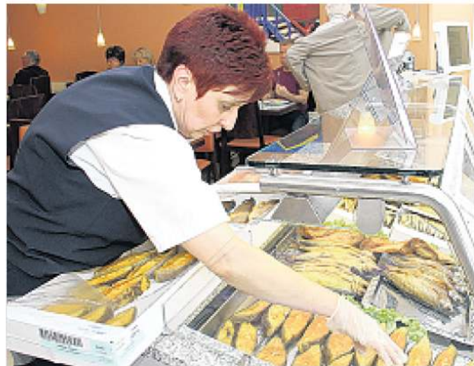
Bei Nordsee gibt es auch frisch geräucherten Fisch - natürlich genauso lecker wie die anderen frischen Fische, die hier auf den Tellern landen.