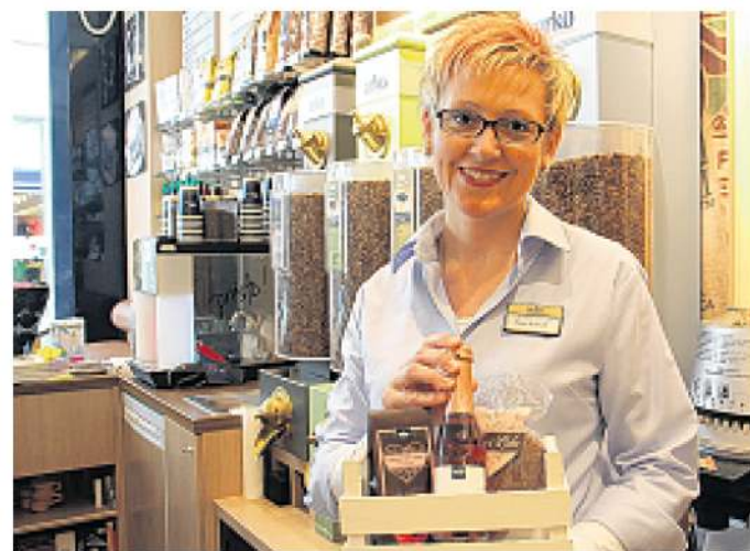
Einen besonderen Präsentkorb für die Mütter haben sich die Mitarbeiterinnen von arko zum Muttertag ausgedacht.