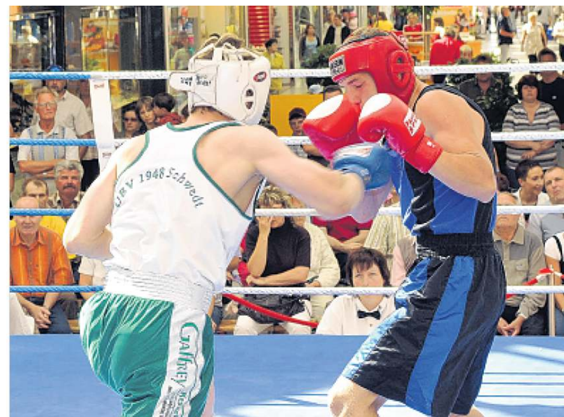
Spannende Boxkämpfe können die Besucher des Centers vom 12. bis 16. Juni erleben.