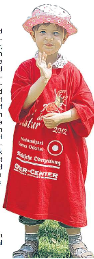
Auch die jüngsten Besucher haben Spaß am Familienfest in Criewen.

Und die Familientour macht einen kleinen Schlenker nach Norden über die Schwedter Schleuse am Schwedter Polder entlang und führt dann südlich weiter nach Criewen. „Ich denke, dass wir auch in diesem Jahr wieder attraktive und anspruchsvolle Touren auf die Beine gestellt haben“, sagt Hans-Jörg Wilke von der Nationalparkverwaltung. Start ist zehn Uhr auf dem großen Parkplatz am Oder-Center.