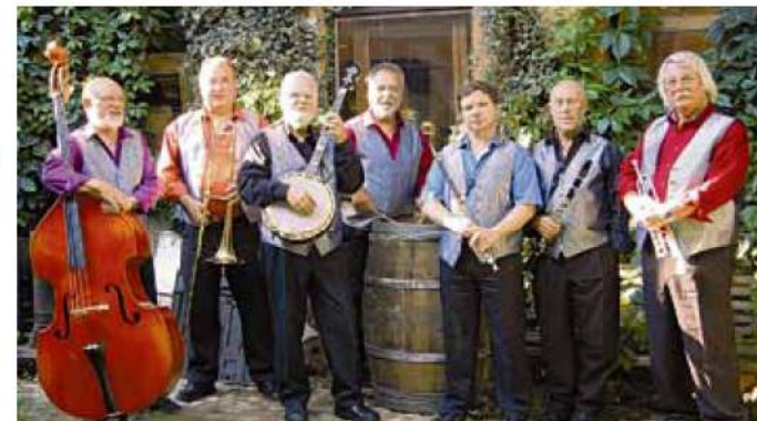
Jazz-Fest zu Pfingsten. Drei tolle Tage lang wird das LaGa-Gelände zur Bühne für Dixieland, Swing und Co. Mit dabei auch die Jazzband Papa Binnes.

Am 12. Mai steht das Programm auf der Festbühne im Seepark ganz im Zeichen des Schlagers. Für das Thema „Schlager auf der LaGa“ konnten die Stars Linda Feller und Olaf Berger gewonnen werden. Sie stehen ab 15 Uhr auf der Freilichtbühne und werden ihre Fans begeistern. Linda Feller, die mit ihren Country- und Schlagerauftritten ihr Publikum begeistert, wird Songs von ihrem aktuellen Album singen. Olaf Berger, der einer ostdeutschen Musikerfamilie entstammt, wurde mit Songs wie „Ich liebe Dich noch immer“ und „Abends fängt die Sehnsucht an“, deutschlandweit bekannt.