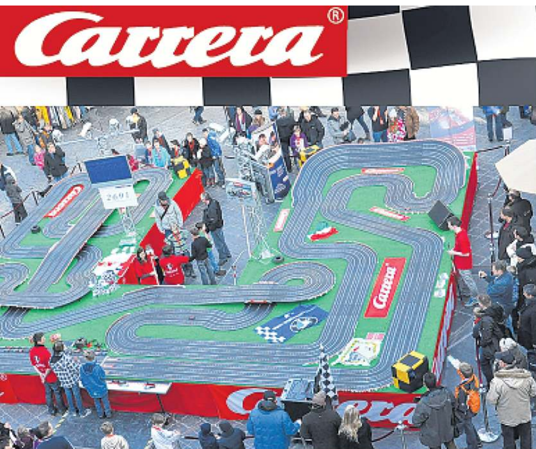
Renntergerien pur garantiert die Carrera-Aktion, die vom 26. bis 31. August im Center stattfindet. Sechs parallele Fahrstationen lassen die Starter schnell zum Zuge kommen. Die Strecke ist über 70 Meter lang.