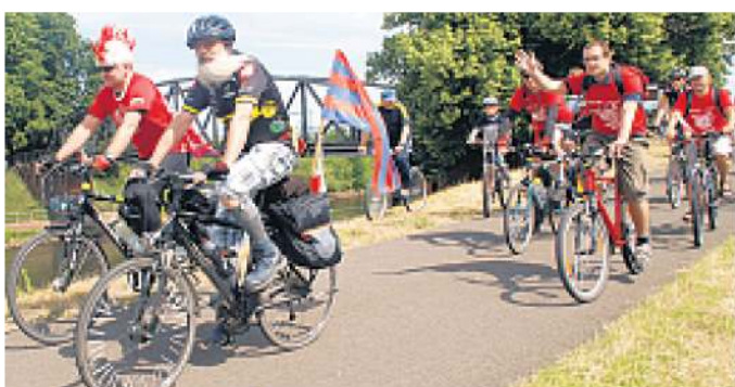
Dafür, dass die Teilnehmer Fahrspaß pur haben und ihre gute Laune behalten, sorgt ein Team mit vielen Partnern.