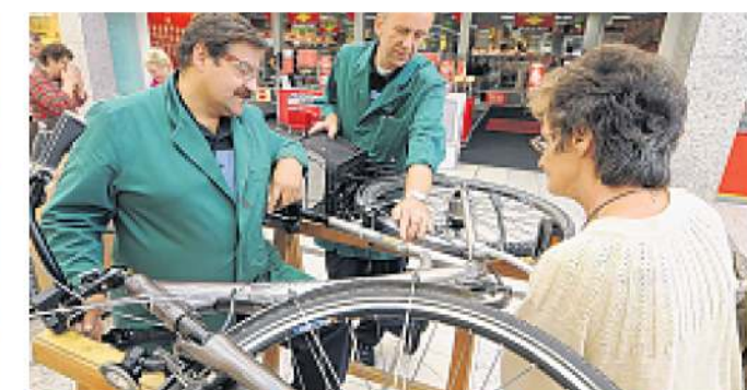
Im Vorfeld der Tour de Natur codiert die Polizei am 22. und 23. Mai Fahrräder im Oder-Center.