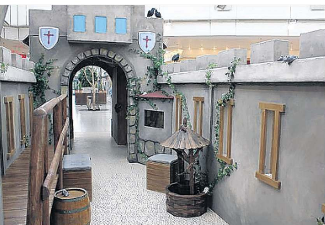
In die Ritterzeit entführt die diesjährige Ferienaktion die Kinder vom 20. bis 29. Juni.