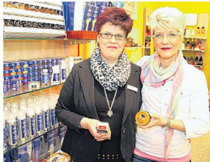
Sage und schreibe 31 verschiedene Schuhcreme-Farben haben die Verkäuferinnen von anika-Schuhe im Angebot.