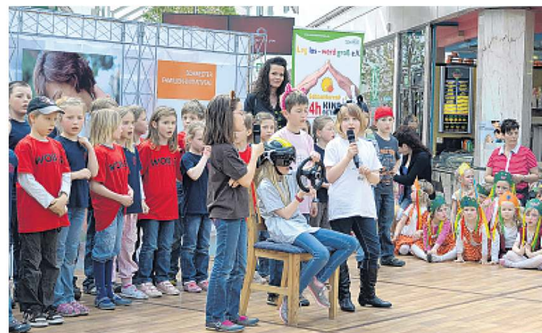
Leistungsfähige soziale Stadt: Beim family day präsentierten sich viele Vereine mit ihren Angeboten für Familien.