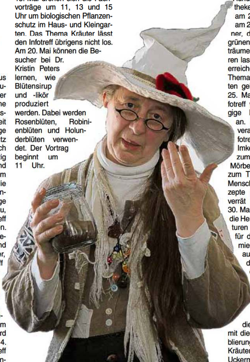
Die Hexe Klecks erklärt, wie man aus Wildkräutern leckere und gesunde Salate zaubern kann.

15. Mai drehen sich die Fachvorträge um 11, 13 und 15 Uhr um biologischen Pflanzenschutz im Haus- und Kleingarten. Das Thema Kräuter lässt den Infotreff übrigens nicht los. Am 20. Mai können die Besucher bei Dr. Kristin Peters lernen, wie Blütensirup und -likör produziert werden. Dabei werden Rosenblüten, Robinienblüten und Holunderblüten verwendet. Der Vortrag beginnt um 11 Uhr.