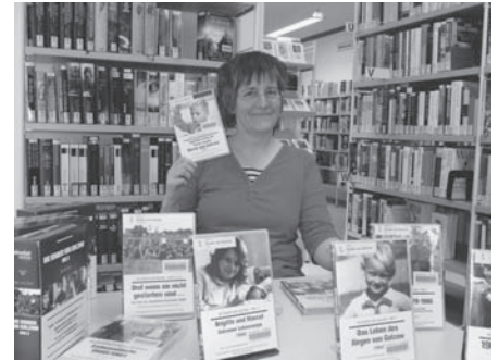
Eine Mitarbeiterin der Stadtbibliothek präsentiert stolz die DVD-Sammlung der „Kinder von Golzow“.

Die Kinder von Golzow – in Box 3 (4 DVDs) enthalten: