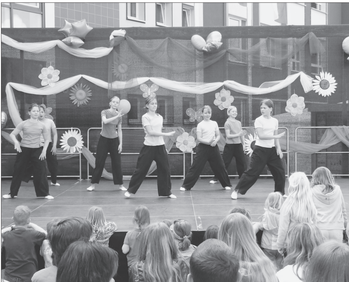
Tanzgruppe der Musik- und Kunstschule im Rahmen des Bühnenprogramms am 8. Schwedter Kinder- und Jugendtag

Stadt Schwedt/Oder im Internet: http://www.schwedt.de