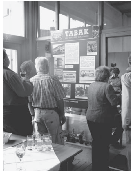
Eröffnung der Sonderausstellung „Rund um den Rauchtobak“

Zu erreichen sind die Mitarbeiterinnen des Tabakmuseums Vierraden unter der Telefonnummer 03332 250991. Öffnungszeiten: Dienstag bis Donnerstag von 10:00 bis 16:00 Uhr, Sonnabend und Sonntag von 10:00 bis 17:00 Uhr