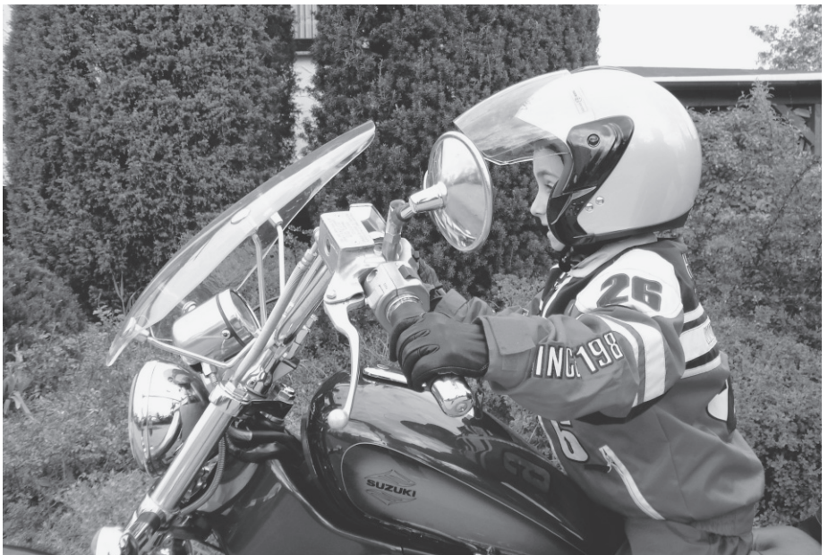
Auf zur Blutsbrüder tour!

Im Rahmen der neuen Blutspendeaktion in Uckermark und Barnim, unter dem Motto „Die Geschenkidee 2008 – Leben retten. Lächeln schenken.“, findet am 14. Juni 2008 die 1. Asklepios Blutsbrüder tour statt.