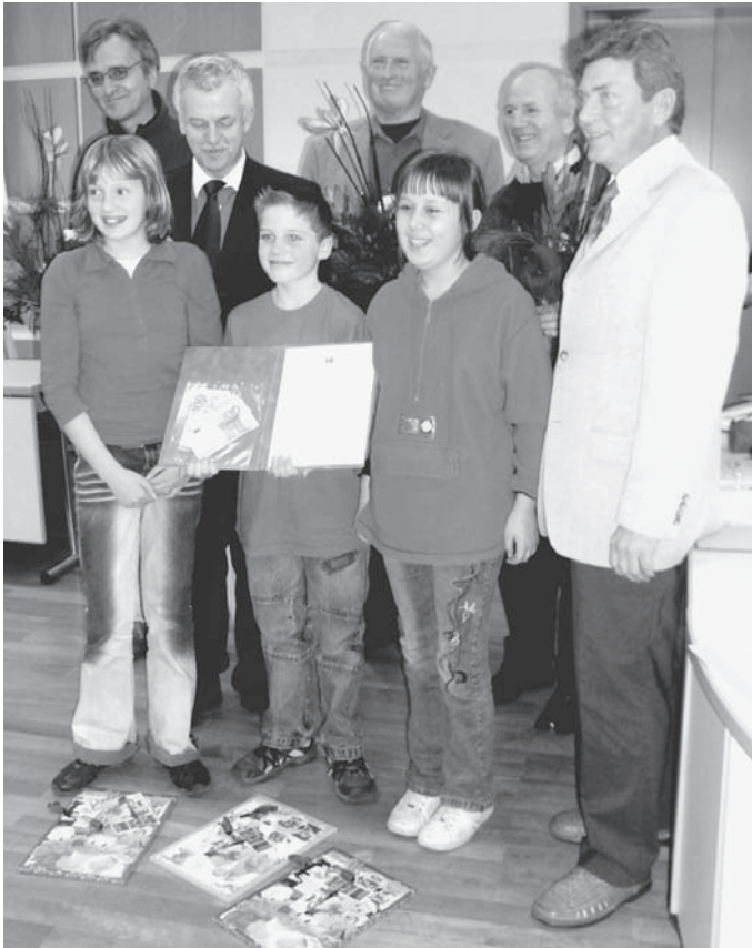
Auszeichnung mit dem Umwelt- und Naturschutzpreis 2007

Bürgerinnen und Bürger, Vereine und Verbände, Bürgerinitiativen, Interessengemeinschaften und Organisationen, Schulen und Kitas sowie Kinder- und Jugendgruppen sind aufgefordert, sich mit Projekten um diesen Preis zu bewerben.