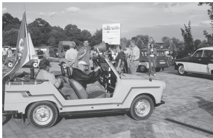
Archivbild Oldtimerschau 2007