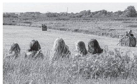
Auf dem Programm stehen wilde Waldrallys durch den Nationalpark, Lagerfeuer mit Knüppelpeig und Entdeckertouren zum Biber.

Nicht zuletzt wegen der großen Nachfrage nach den beliebten Ferienlagern im Sommer wird auch in diesem Jahr wieder eines im Herbst