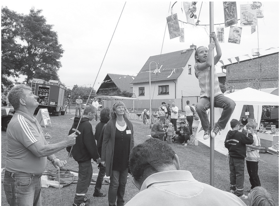
Auf der gesamten Festmeile gibt es viele spielerische Attraktionen für Groß und Klein.