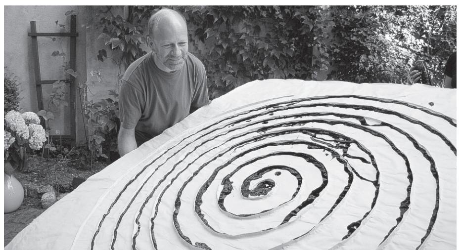
Die „Polder-Spirale“ des polnisch-dänischen Künstlers Wojciech Laskowski entsteht.