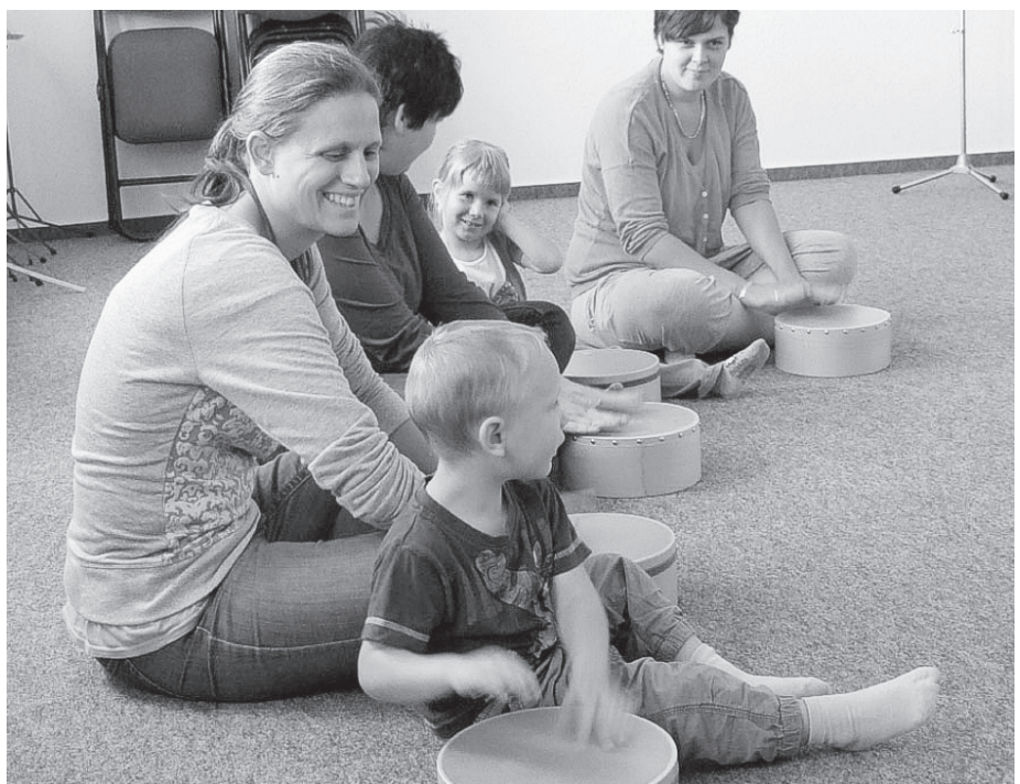
Zaghaft oder aufgeregt werden die ersten Aktionen mit musikalischen Geräuschen, Klängen und Instrumenten probiert.