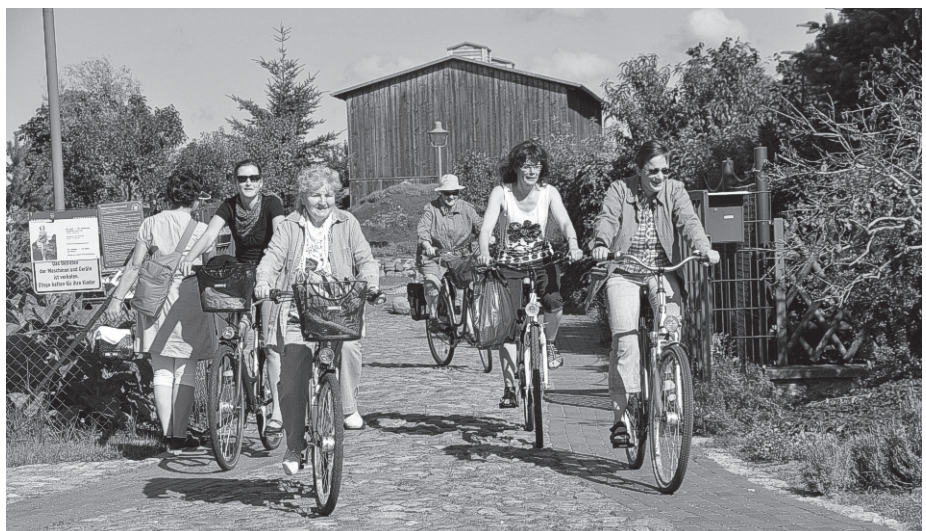
Ausfahrt zum Tag des offenen Denkmals 2012