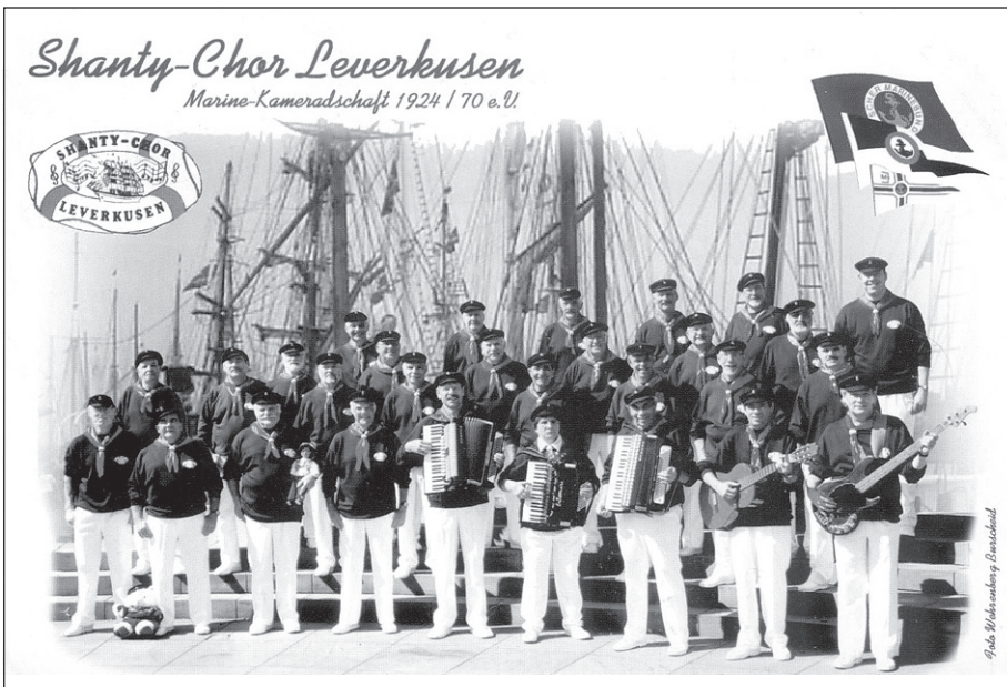
Shanty-Chor der Marine Kameradschaft Leverkusen 1924 e. V.