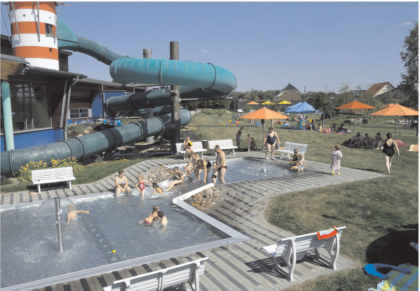
Genießen Sie den Sommer im Schwedter Freizeit- und Erlebnisbad oder in den umliegenden Seen der Uckermark.