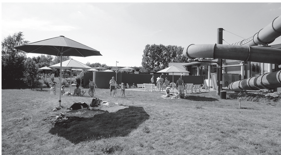
Die großzügigen Außenanlagen bieten Schattenplätze und ein Kinderplanschbecken.

Bei schönem Wetter lädt auch die große Liegewiese mit Kleinkinderbecken und Spielplatz zum Entspannen und Sonnen ein.