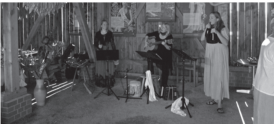
In diesem Jahr findet das Fest zur Tabakköst im Tabakmuseum Vierraden statt und die Abendveranstaltung entfällt.